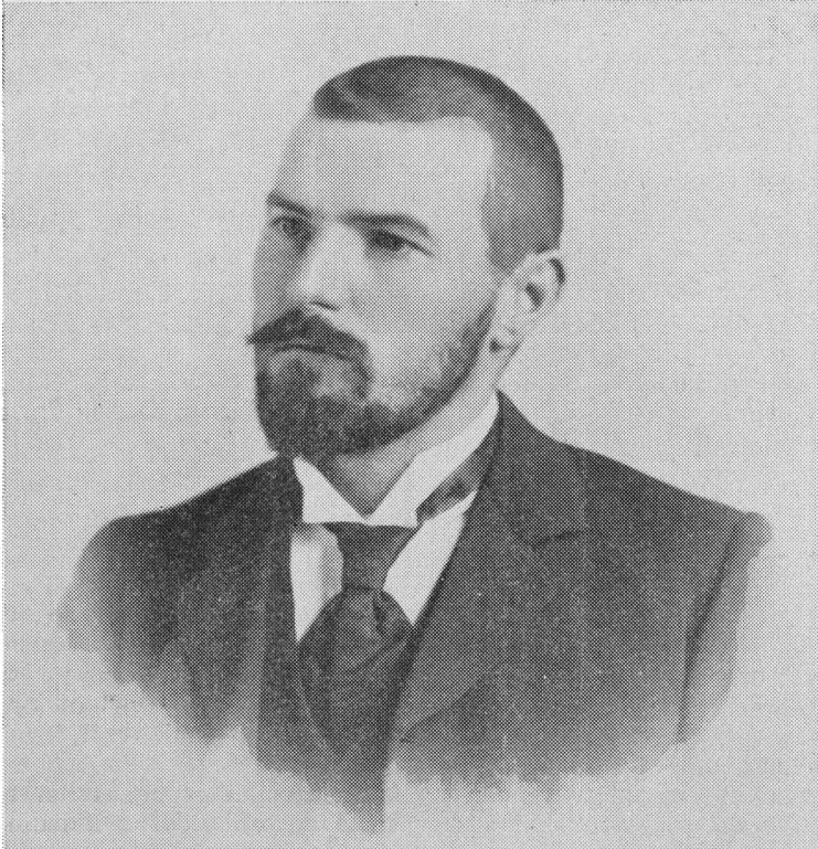
Dr. Arnold Theiler, die Eerste Staatsveearts van die Suid-Afrikaanse Republiek.

„Die gevrekte diere het by die dosyne rondgelê en die verarmde transportryers het radeloos daar rondgestaan. Hulle het die osse wat oorgebly het maar geslag en daar biltong van gemaak om hulle van 'n hongerdood te red.” Theiler bly etlike dae in Palapye en ontmoet die natuurlike kaptein Khama, van wie hulle etlike beeste ent. Daarna gaan die reis na Mafeking. Hy merk wagte op die Transvaalse grens, wat op sy aan-