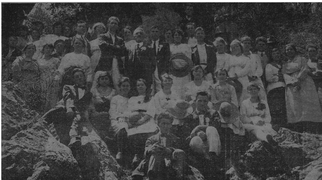
Lede van die eerste Asaf-koor, afgeneem op Weltevreden, Fairlands, tydens 'n uitstalling in 1920.