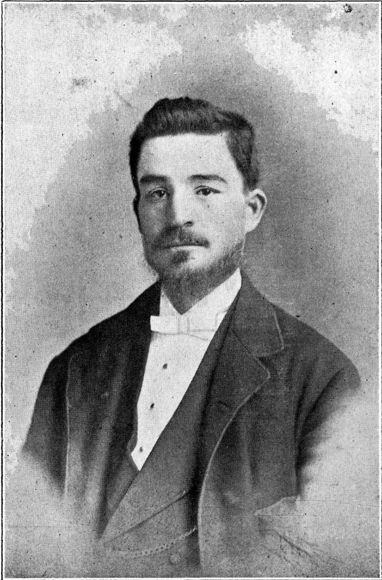
CHRISTIAAN DE WET, TOE HY VOLKSRaadSLID VAN DIE S.A. REPubLIEK WAS.