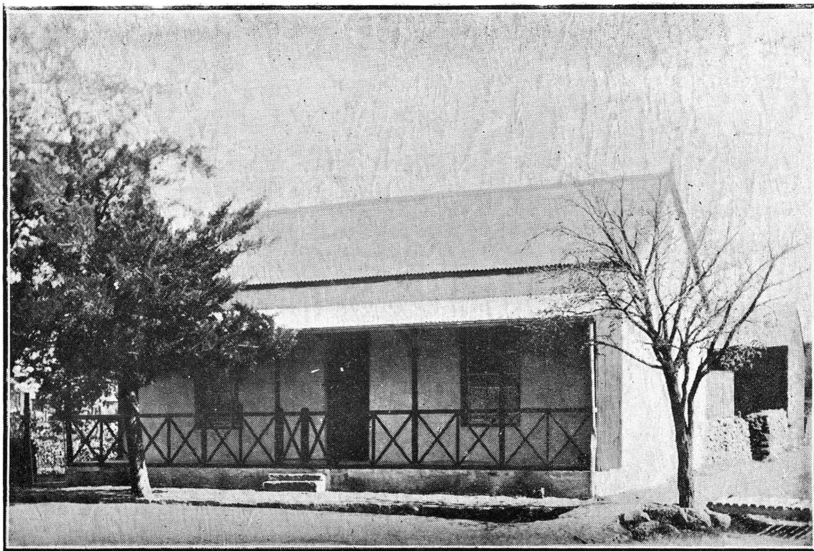
WOONHUIS OP DEWETSDORP VAN DIE VADER VAN GENERAAL DE WET.