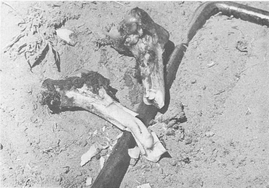
Figuur 37: Femur van 'n springbok stukkend gekap sodat die murg ondersoek kan word, waarvolgens die fisiese kondisie van die prooi bepaal kon word. Gemsbokpark 1970.

Deur die gebruik van spoorvolvoetspoor as 'n meetroed van die bewegings van jagdiere in die Gemsbokpark is betoedat, en deur noukeurige ontsoekings van afdruke en tye te maak, is 'n getalstelsel gestel van alle moontlike jagdiere en natuurlike vangste oor 'n lang tydperk, in plaas van 'n enkele. Deur die berekening van gemiddeldes kan die aantal vangste en natuurlike jagdiere per kilometer of per uur werkings tyd. Hierdie waarnemings met die jagdiere (Sulaxia jagdiere) of natuurlike vangste (natuurlike vangste), is getalstelsel van 'n enkele (afsondering van die jagdiere natuurlike vangste) word in Tabel 27 gegee.