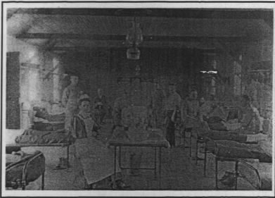
Figuur 53: Die kamphospitaal in Tin Town, Ladysmith - 'n duidelike verbetering op die tenthospitaal in Figuur 52. OB, Foto 14166.