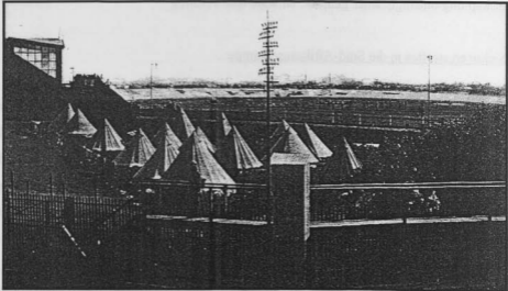
Figuur 52: Die kamphospitaal in Groenpuntkamp het aanvanklik slegs uit 'n aantal tente (in die voorgrond) bestaan. In die tweede helfte van 1900 is 'n sinkgebou opgerig, wat toe as hospitaal gedien het.