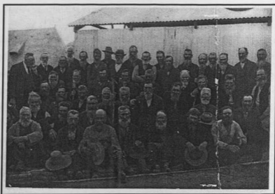
Figuur 50: 'n Groep van die oudste krygsgevangenes in Groenpuntkamp. OB, Foto 2761.