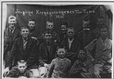
Figuur 51: Penkoppe in Tin Town, 1901. Alhoewel sommige van hulle krygsgevangene geneem is, is die meeste kinders slegs aangekeer om te verhoed dat hulle by die kommando's aansluit.