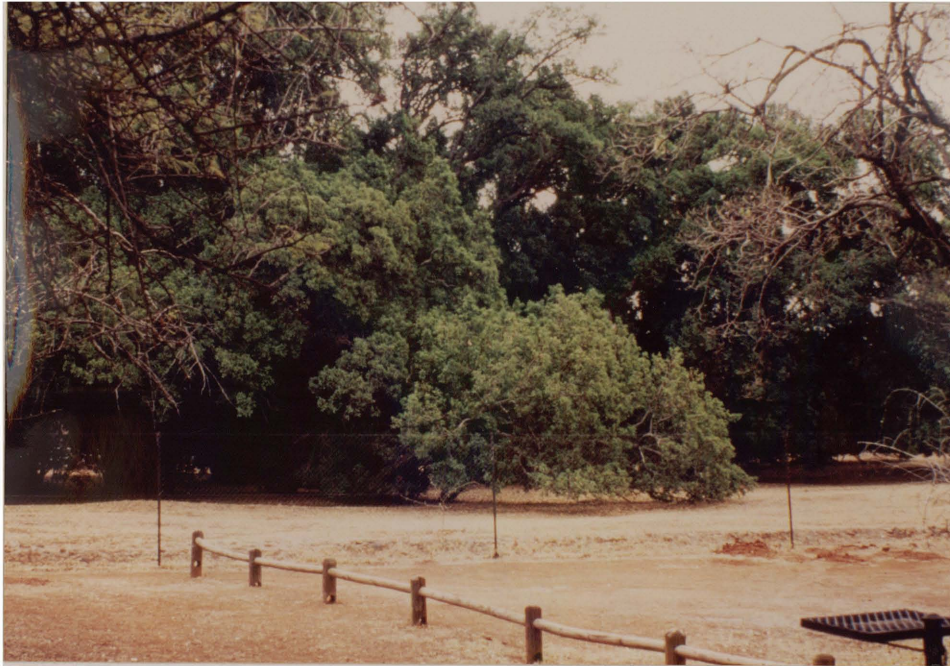
Figuur 4.7 Die Wonderboom. Geen teken van Mzilikazi se vestiging is vandag hier sigbaar nie.