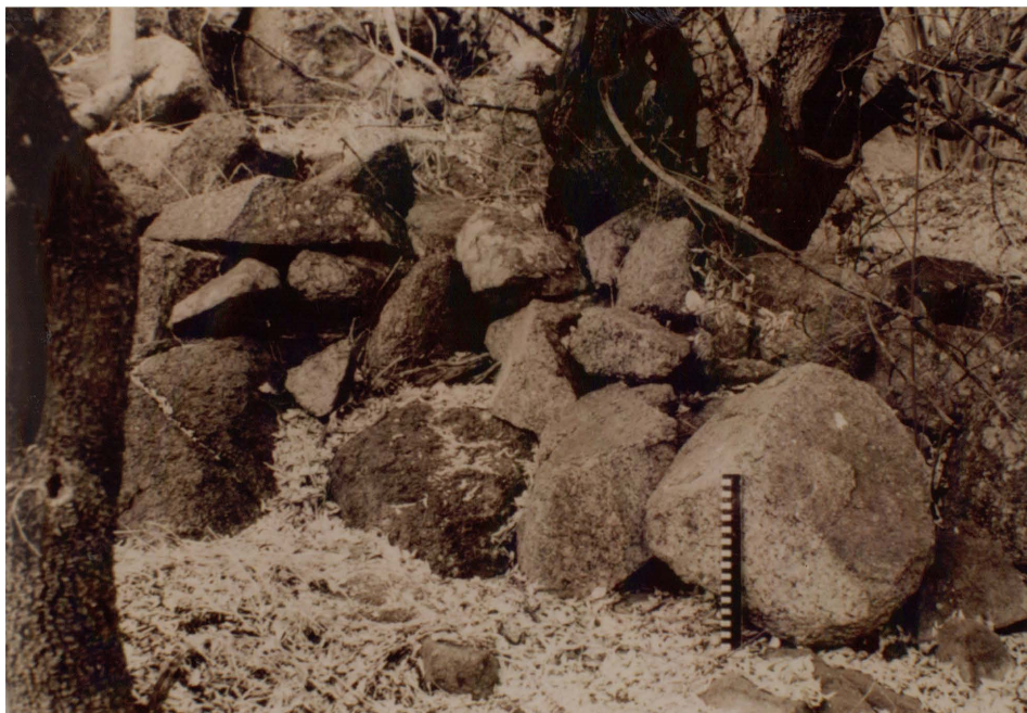
Figuur 4.5 Laat Ystertydperkerrein by Tswaing.