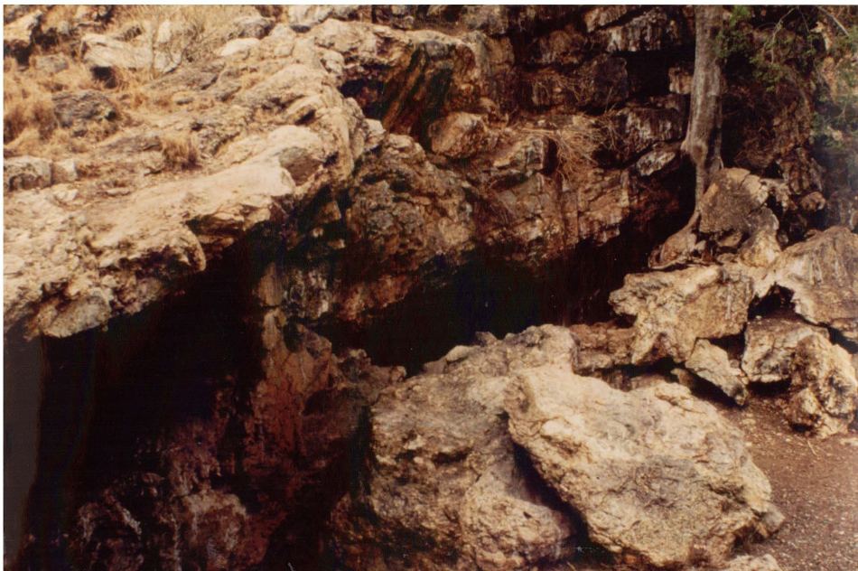
Figuur 4.3 'n Grot in die Groenkloof natuurreservaat waar Laat Steen- en Ystertydperkarterefakte gevind is.