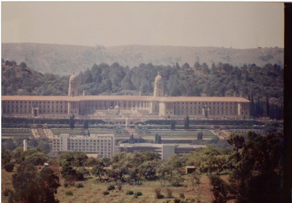
Figuur 4.6 Meintjieskop, soos dit vandag daar uitsien. Bo en behalwe die Uniegebou, is verskeie klipterrasse en -paadjies uitgelê. Geen spoor van Mzilikazi se kraal kon gevind word nie.