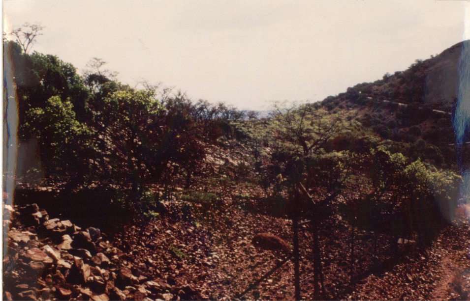
Figuur 4.2 Die Laat Acheulterrein te Wonderboom, soos dit vandag daar uitsien. Dit is waarskynlik die bekendste Vroeë Steentydperkterrein in Pretoria.