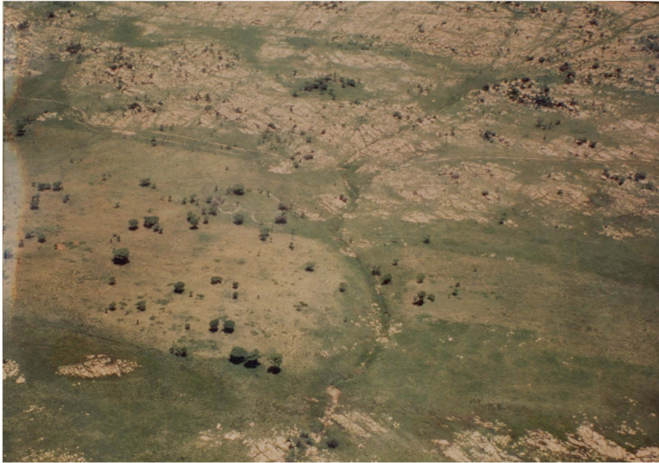
Figuur 4.4 Laat Ystertydperkerrein op die Magaliesberg.