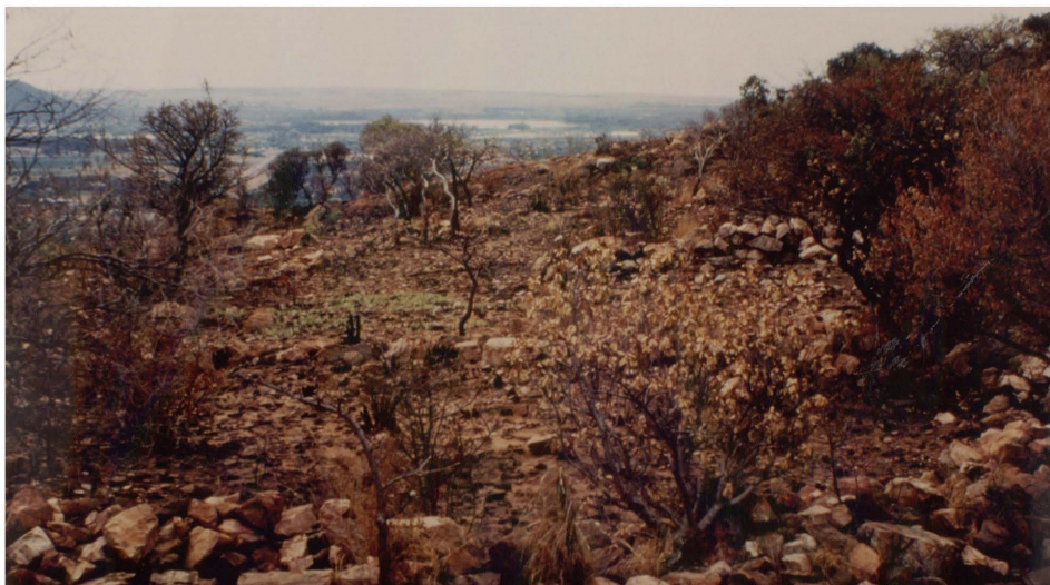
Figuur 4.8 Klipmure is suid en wes van die Wonderboom teen die berghang gevind. Dit is onbekend of dit met die vestiging van Mzilikazi verbind kan word