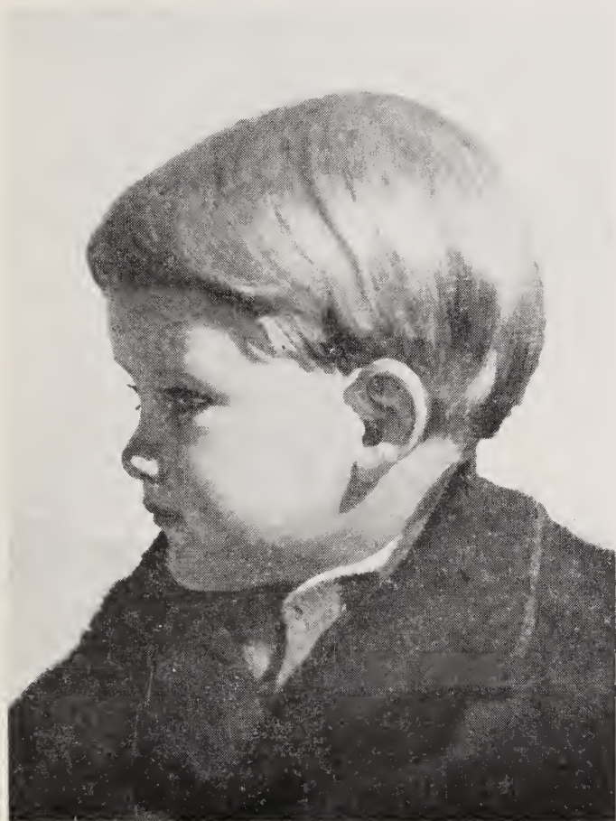
W. H. Coetzer: SEUNSKOP IN OLIEVERF (Patscha van den Heever)