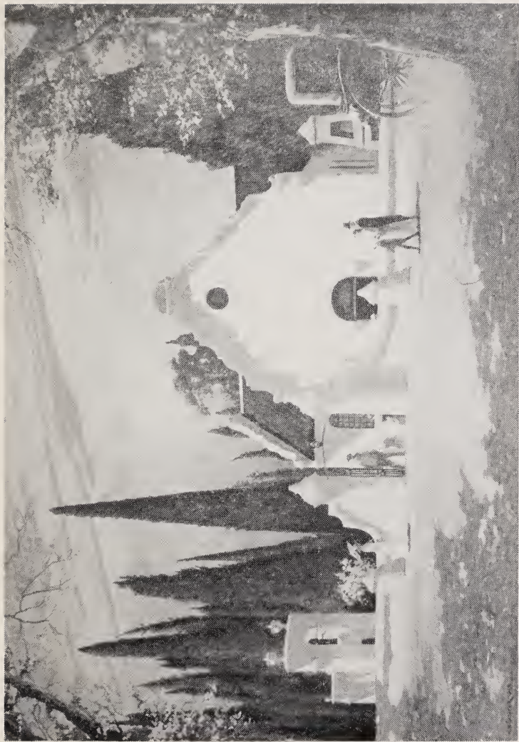
W. H. Coetzer: KERK, PAARL