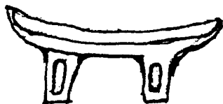
Šiseketelo šiqamelo — Zulu origin

Ku tsemiwa šipombondzwana šī phaphiwa šī endla mivamba; e henhla ni le hansi ku tshikisiwa šisweswo nkarhi lowu ku karhiki ku vatliwaka. Ku fanele ku kovotliwa lomu šikarhi ku šī sasekisa tihelo riwana ku hunguta ku tika. Ku nga siyiwa swo tihiva swirharhu kumbe mune ku landza vukulu bya šiseketelo. Va kavotla va boša matihelo mambirni ma hlangana. Le'swi siyiweke swi tihiva swa vatliwa swi tswhulungeka swi saseka. Hala henhla ku endliwa wo nge ku phovorhela e šikarhi ku tlakuka lomu matihelo leswaku šī ta amukele swinene nnloko kumbe nhamu. Loko šī vatliwile šī hetisisiwile šī tswhulungekile šī ta fanela ku sasekisiwa. Šī tsariwa mavala hi ku kenyakenya swi hambana-hambana, kutani e ndzhaku swi ta endliwa leswaku swi vonaka swinene hi ku hisahisa hi tihari le'ri hisiweke e naziweni ri pihatela-pihatela. Šiseketelo leswi swi ni tinsakakaka hi ku tekela-tekelana ka vanhu loko va vndzamene hi matiko lawa va akeke ka wona. Tshaku rona ri fanele ku lulama swinene ri ta kota ku tikirnela e hansi. Šiseketelo leswi swi tirhisiwa hi vakulukumba (makhehla) hi leswaku la'va knehliweke swidlodlo. Swidlodlo leswi swi rhungeferiwa e misisini, masuku loko munhu a etlela aha swi koti ku šī susa, hikwalaho nnloko yi fanelaka ku hayekiwa e šiqamelweni leswaku šidlodlo šī nga onheki hi ku pnateka loko šī knumba e hansi. Šidlodlo šī endliwa hi mumpfu wa tin, oši.