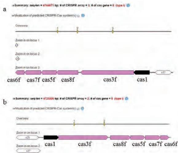
Рис. 2. Структура CRISPR-Cas системы Y. Pseudotuberculosis : а) штамм IP32953 и б) штамм IP31758. Белок cas3f представлен двумя белками: хеликазой cas3 и эндонуклеазой cas2 . Белки cas1 и cas2 участвуют в вырезании небольшого фрагмента (протоспейсера) из генетического материала МГЭ и интегрируют его в CRISPR-касsetу. Комплекс Cascade Y. pseudotuberculosis образован белками cas8f , cas5f , cas6f и шестью мономерами белка cas7f . Cascade узнает чужеродную ДНК и, при наличии мотива, прилежащего к протоспейсеру (PAM, protospacer adjacent motif), и совпадении первых восьми нуклеотидов, активирует белок cas3f , который разрезает и запускает деградацию чужеродной нуклеиновой кислоты [5, 14, 15]

Установлено, что CRISPR-система иерсиний включает в себя от одного до трёх локусов и комплекс cas -генов (CRISPR-система первого класса, тип I) (рис. 2) [3, 15].