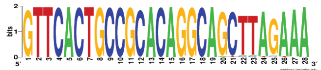
Рис. 3. Консенсусная последовательность повторов штаммов Y. pseudotuberculosis IP32953 и IP31758. Размер букв обратно пропорционален частоте замены нуклеотида

CRISPR-системы представлены шестью cas -генами и кассетами, количество которых различно: штамм IP32953 имеет три локуса (YP1, YP2 и YP3), а штамм IP31758 — два (YP1 и YP3) (см. рис. 2). Следует отметить, что кассеты расположены в геноме не последовательно и разбросаны по хромосоме, но при этом имеют четкую локализацию между генами: локус YP1 расположен между генами, ответственными за синтез альдо- и кеторедуктазы и образование ионного канала; локус YP2 локализован между генами, отвечающими за метаболизм аминокислот; локус YP3 — между генами транспортного белка и экзонуклеазой. Количество повторов и спейсеров в локусах различно, не было обнаружено гомологичных спейсерных последовательностей в локусах данных штаммов. Последовательности повторов, наоборот, полностью идентичны, несмотря на встречаемость замен в повторах в конце кассеты (рис. 3).