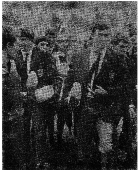
Ontvoering van die Afrikaanse Hoerskool se dirigent tydens die inwyding van A.H.S. se nuwe paviljoen vroeg in die eerste kwartaal.