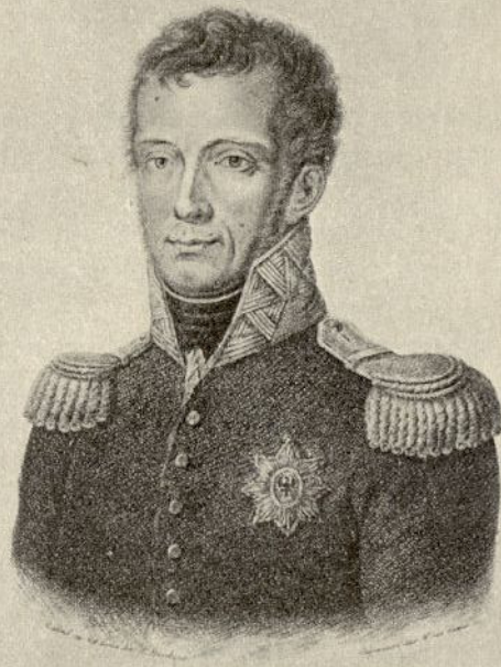
ZIJNE KONINKLIJKE MAJESTEIT WILLEM DE EERSTE KONING DER NEDERLANDEN PRINS VAN ORANJE NASSAU HERTOG VAN LUXEMBURG ENZ. ENZ.