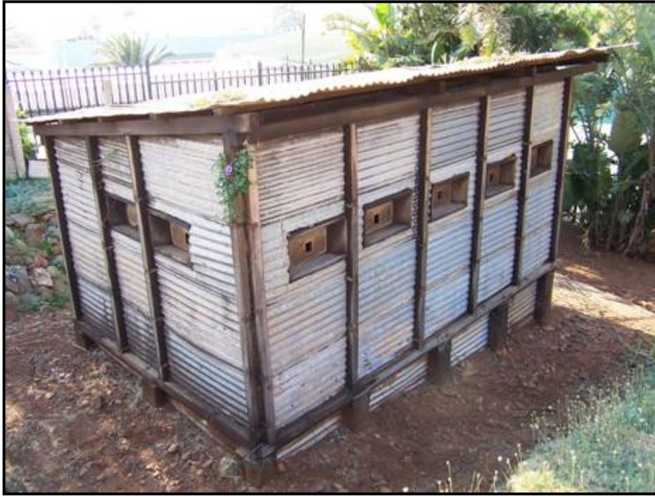
Barberton se vierkantige sinkplaatblokhuis.