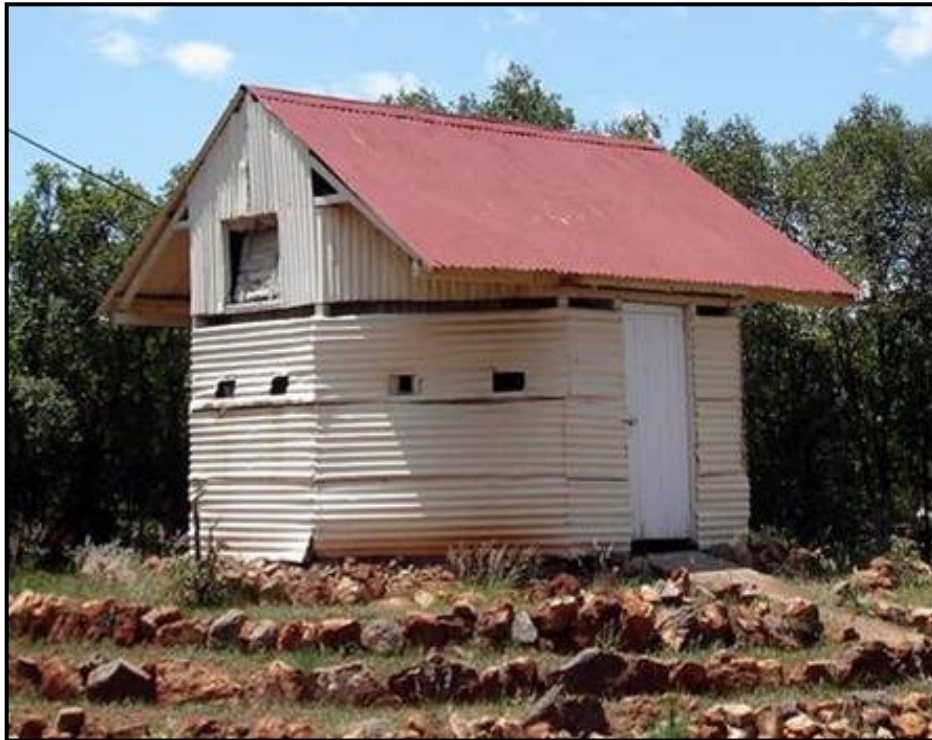
Voortrekkerhoogte se agtkantige sinkplaatblokhuis.