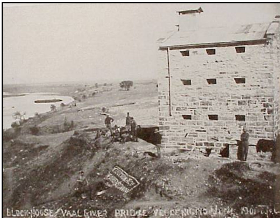
'n Groot klipblokhuis aan die Vaalrivier. Presies so een kan vandag naby Meyerton langs die R59 by die Engen-vulstasie gesien word.