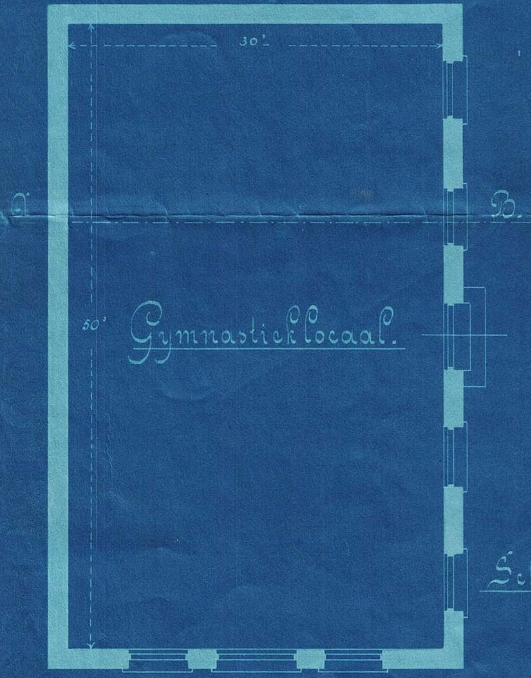
Schaal 1/8 dm = 0 vt.