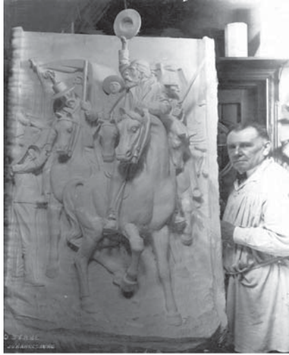
Figuur 5: Anton van Wouw se gipspaneel van die Voortrekkerleier Piet Retief (Bron: Erfenissentrum, Sentrale Volksmonumentekomitee-versameling)