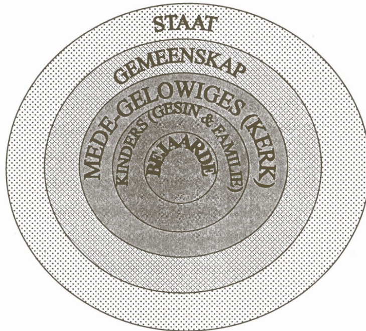
Figuur 5.1 Verpligting tot versorging van bejaardes

Volgens die SKDB se Konsephandleiding oor Bejaardesorg moet die kerk dienste soos maatskaplikewerkdienste, dienssentrums en selfhelp- of helpmekaargroepe vir bejaardes lewer. Tuisversorging kan deur die vroue- en jeugaksies, selfhelp- en “helpmekaargroepe” asook klubs aangebied word (Norval, 1987: 46 – 49).