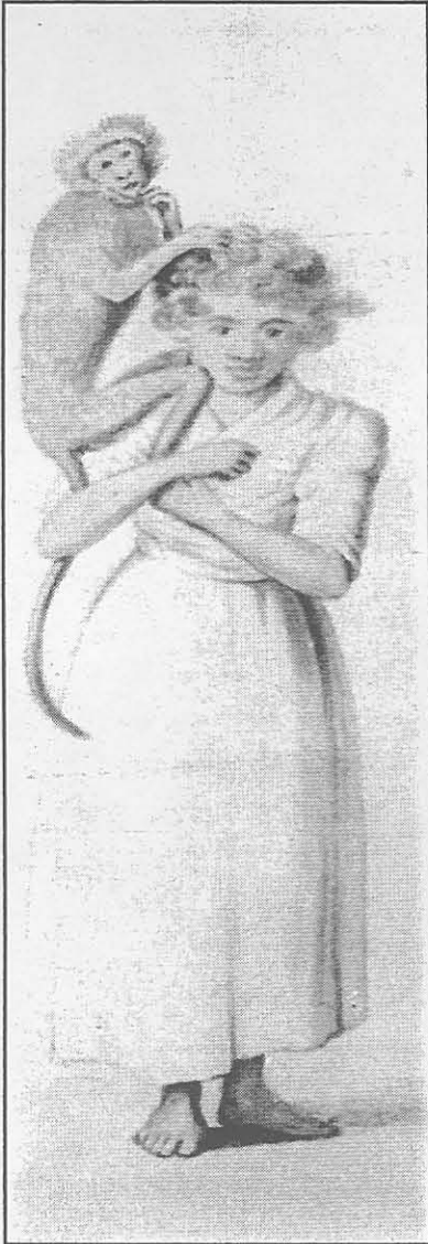
Figuur 3: 'n Kaapse slawemeisie, volgens 'n afbeelding deur lady Anne Barnard (1750 - 1825), eerste dame aan die Kaap gedurende die Eerste Britse Besetting (1795 - 1803), wat ook 'n talentvolle amateurkunsenaar en intelligente en simpatieke waarnemer van die Kaapse inwoners en milieu was. Halfslag Kaapsgebore slavinne was die mees bevoorregte slawegroep in die Kaapse huishoudings.