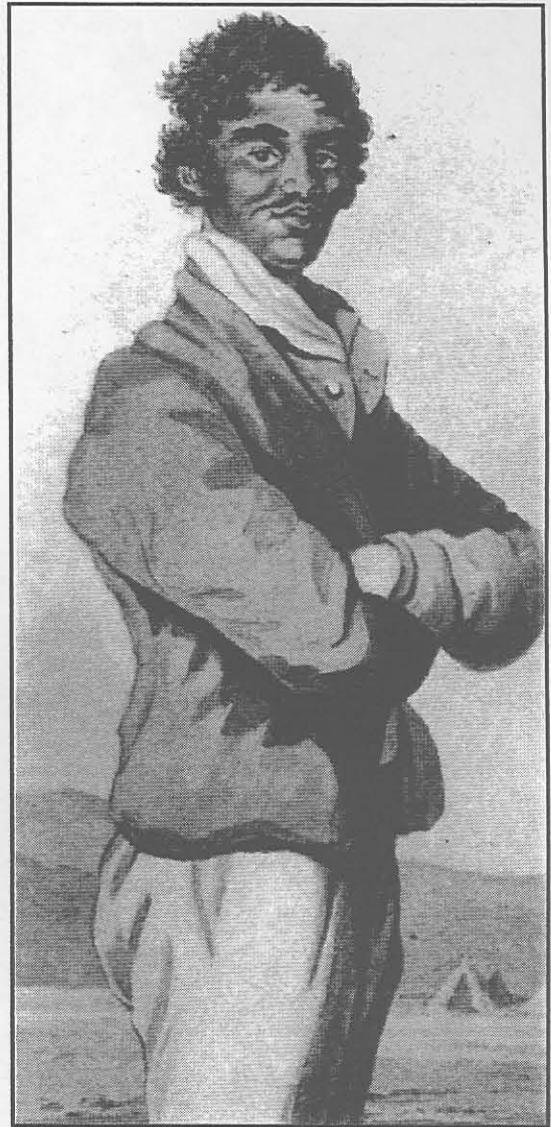
Figuur 4: 'n Kaapsgebore slaaf. Hy was deel van 'n slawegroep wat weens aard, aanleg en arbeidskwaliteite, besonder waardevol en in groot aanvraag by voornemende eienaars was wat astronomiese bedrae sou betaal om van hulle te bekom.

Uit: A.M.L. Robinson (red.), The letters of lady Anne Barnard to Henry Dundas from the Cape and elsewhere, 1793 - 1803 (Kaapstad, 1978), p. 148.