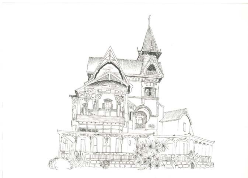
Figuur 23: Die Erasmuskasteel se vooraansig.