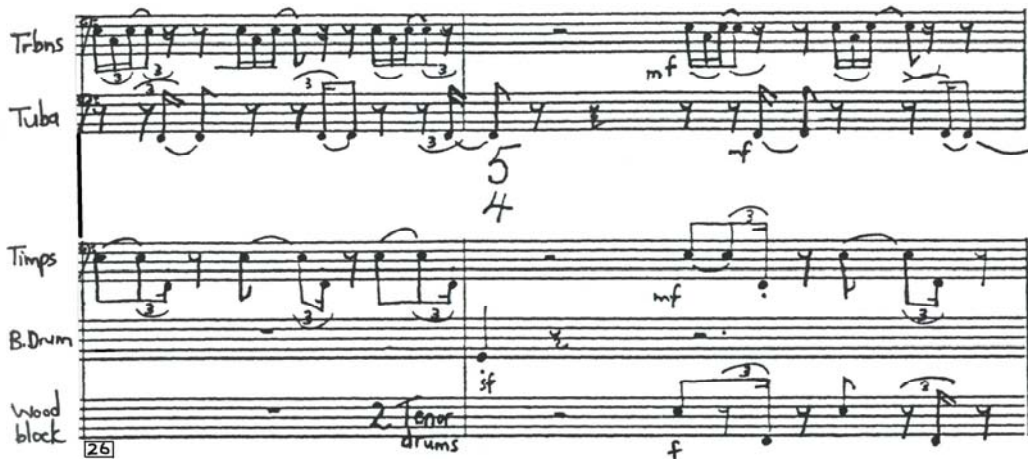
Voorbeeld 5.7: Jeanne Zaidel-Rudolph, Fanfare Festival Overture – 12/8-metrum, poliritmie en ostinaatpatrone, maat 117-118