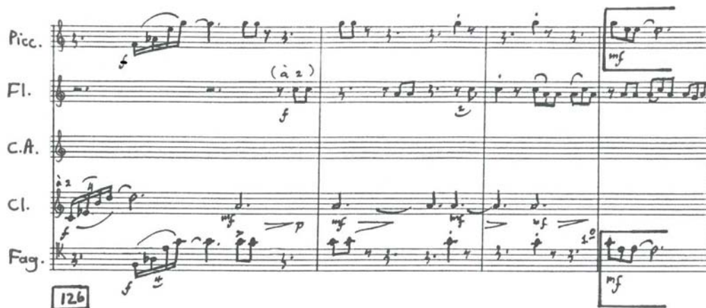
Voorbeeld 5.1: Stefans Grové, Dansrapsodie – 'n Afrika-stad , maat 126-133