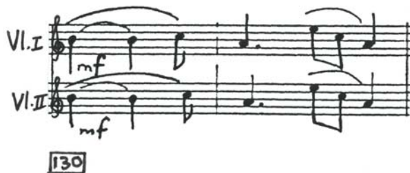
Voorbeeld 5.2: Jeanne Zaidel-Rudolph, Fanfare Festival Overture , maat 130

Daarteenoor tree daar in maat 130 (in die Afrika-deel) van Zaidel-Rudolph se Fanfare Festival Overture slegs 'n kort een-maat-melodie in wat twee maal gewysig herhaal word. Hierdie melodie (oorspronklike melodie voor permutasies) kan in voorbeeld 5.2 waargeneem word.