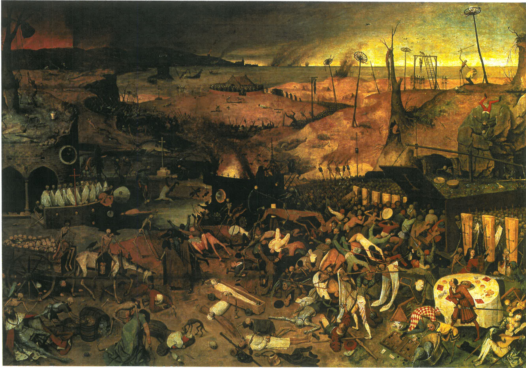
N: De triomf van de Dood (Vöhringer)