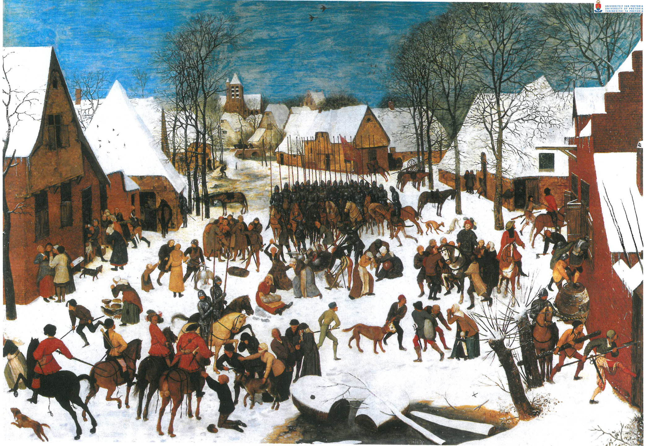
K: De kindermoord te Bethlehem (Vöhringer)