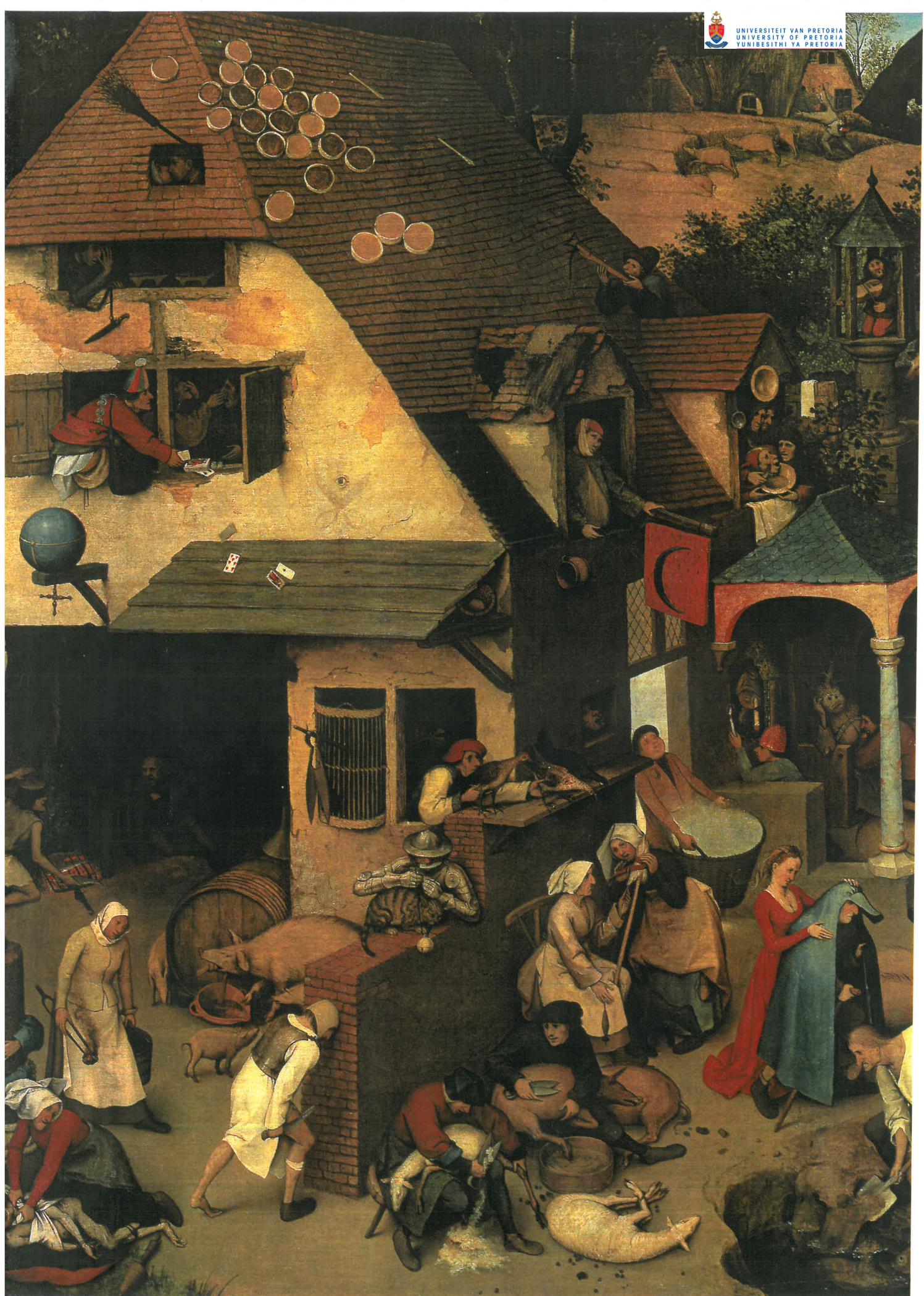
P: Detail van: De Vlaamse spreekwoorden (Vöhringer)