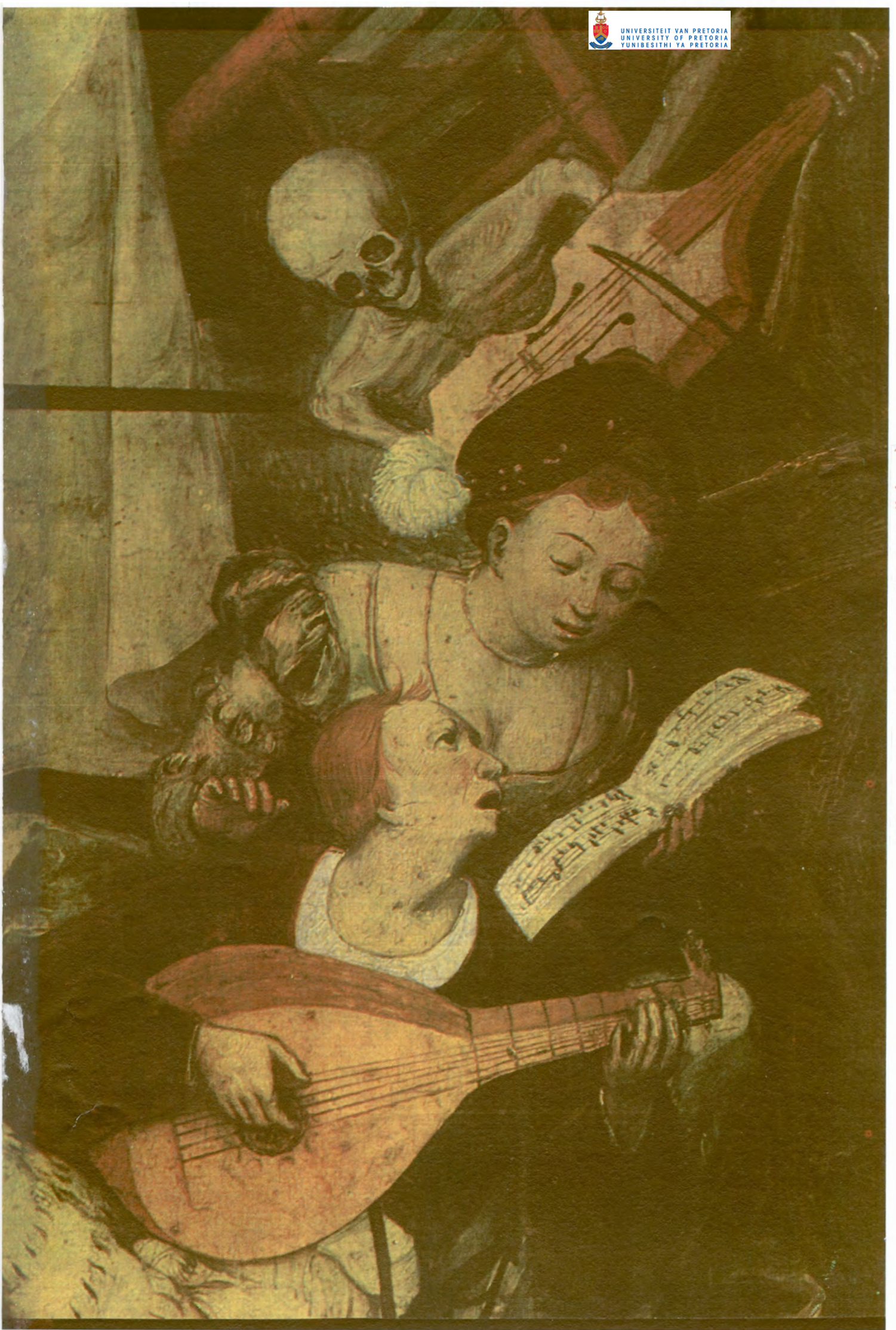
V: Detail van: De triomf van de Dood (Marijnissen)