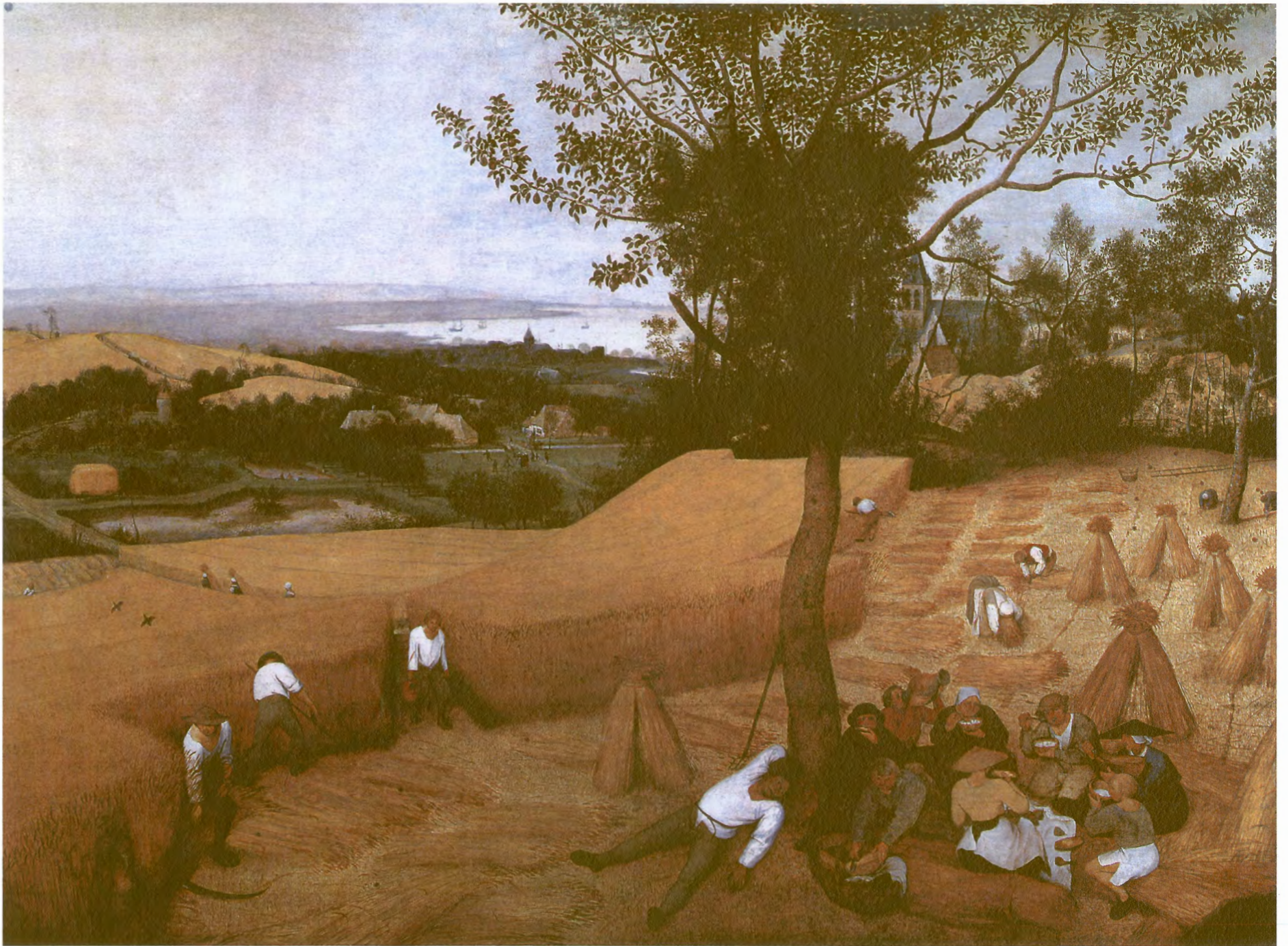
T: De korenoogst (Vöhringer)