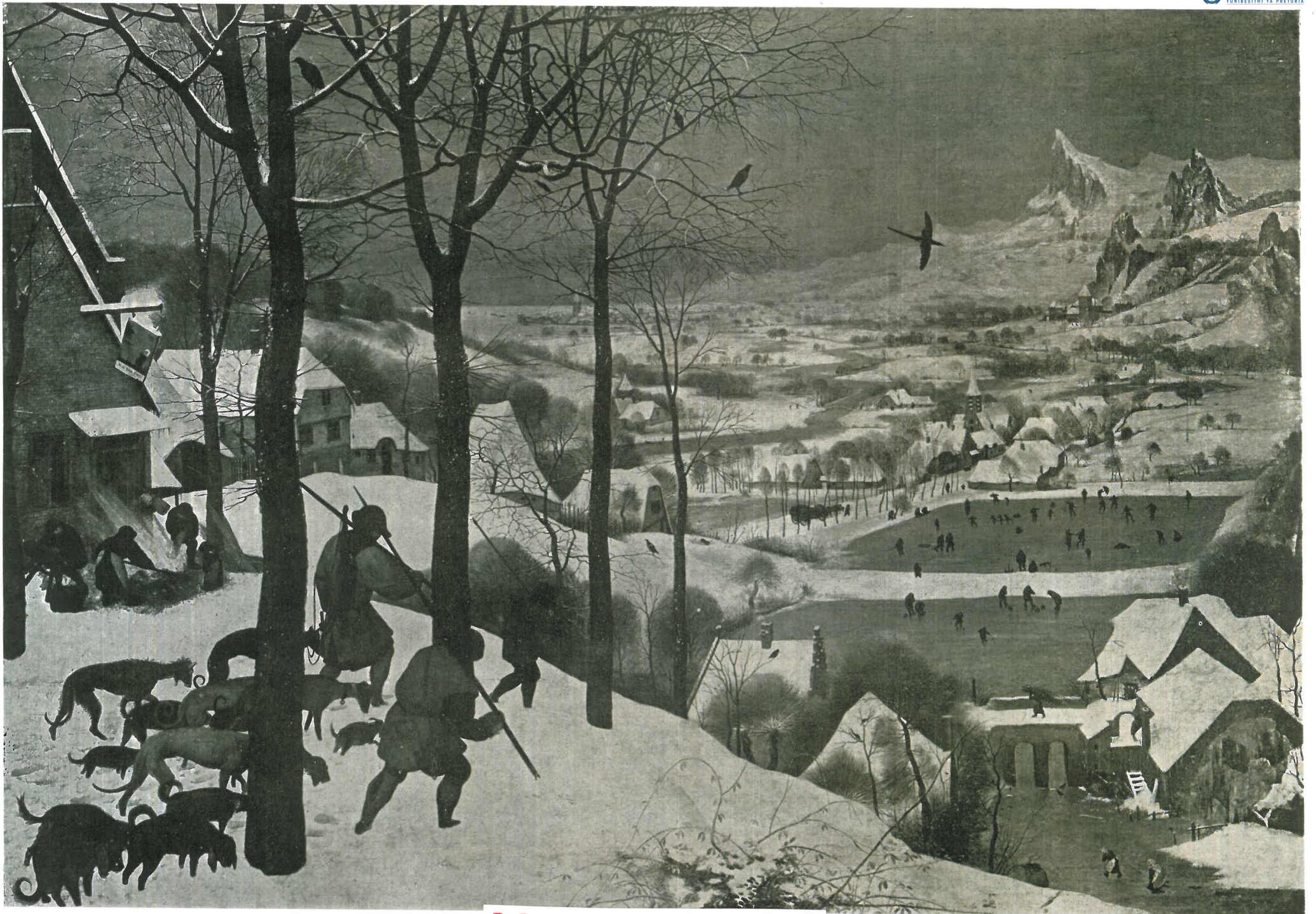
R: De jagers in de sneeuw (Marijnissen)