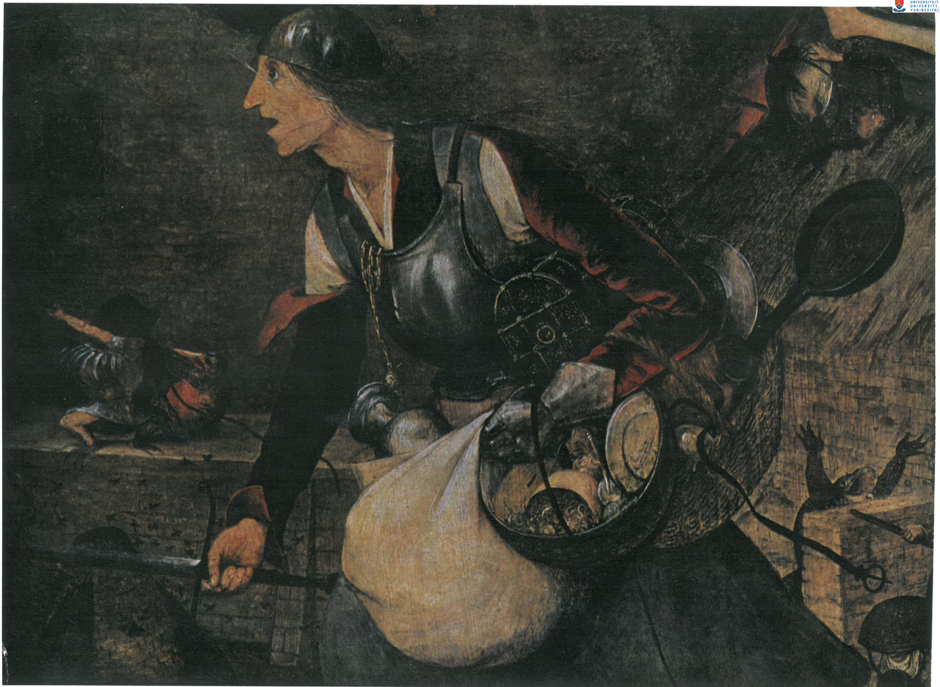
O: Detail van: Dulle Griet (Grossmann)