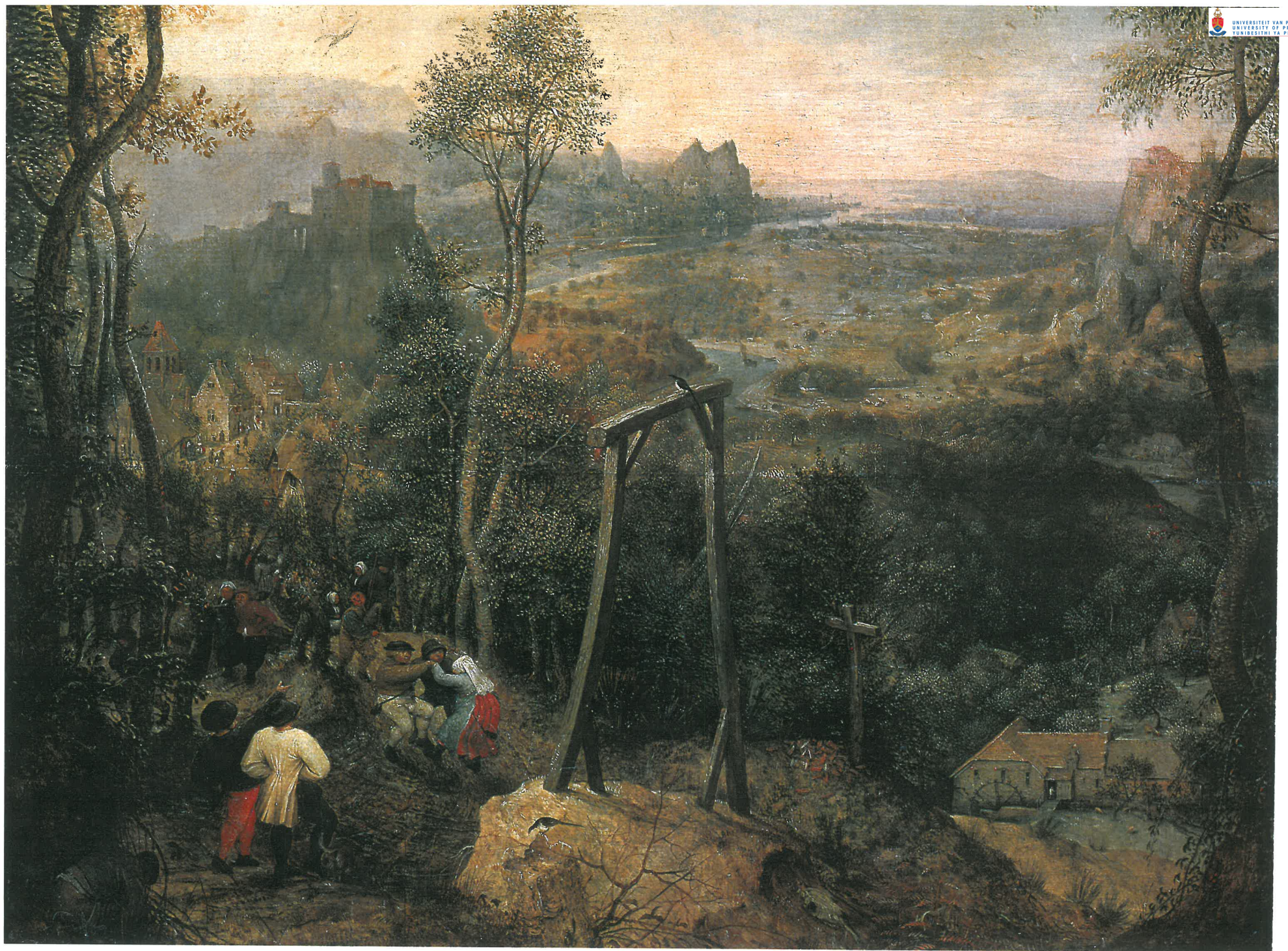
M. De ekster op de galg (Vöhringer)