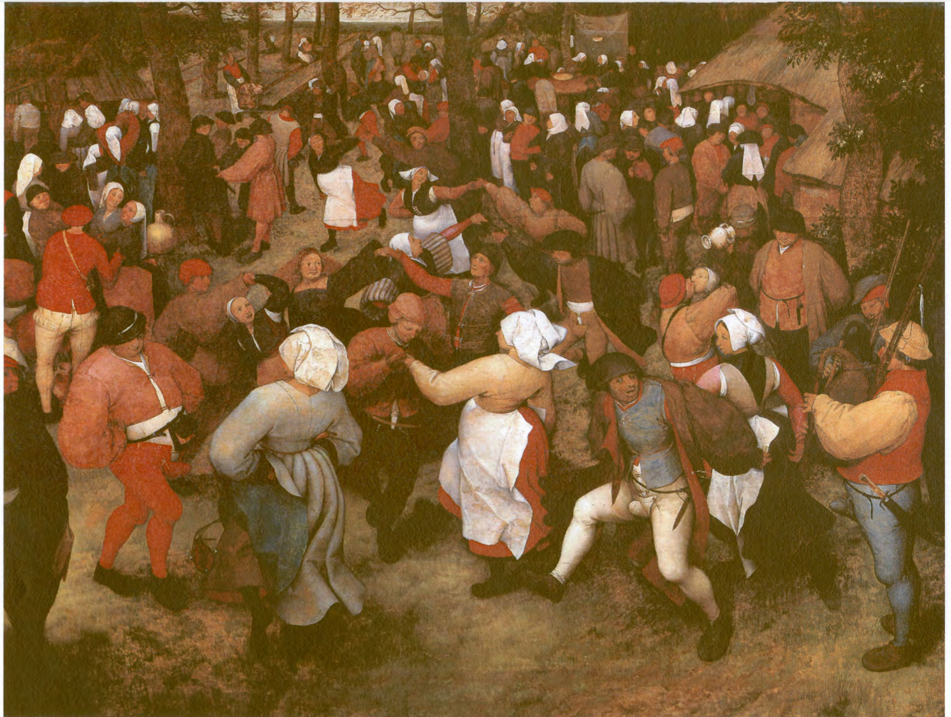
Q: De bruiloftsdans buiten (Vöhringer)