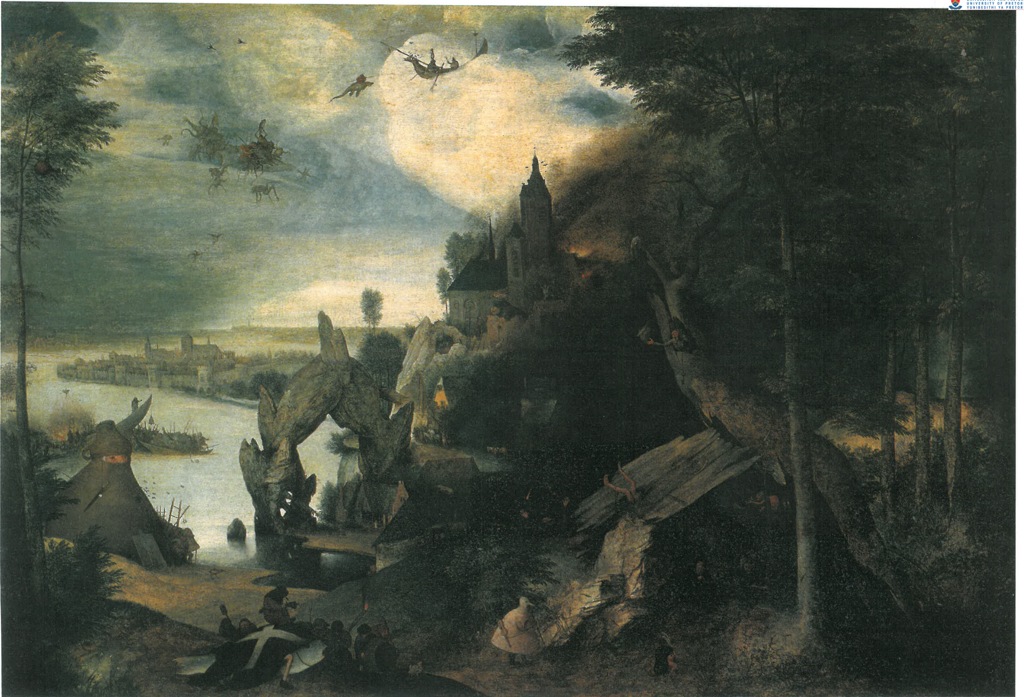
U: De bekoring van St Antonius (Vöhringer)