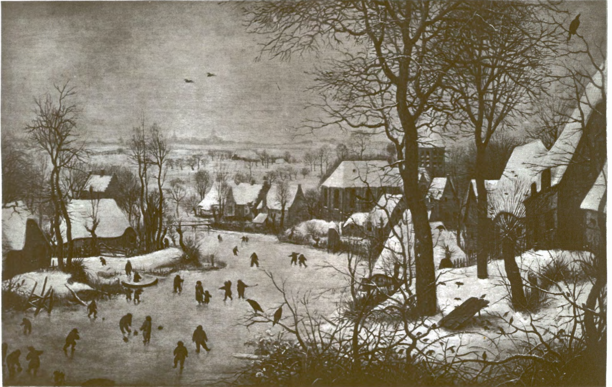
W: Winterlandschap met schaatsenrijders en een vogelval (Grossmann)