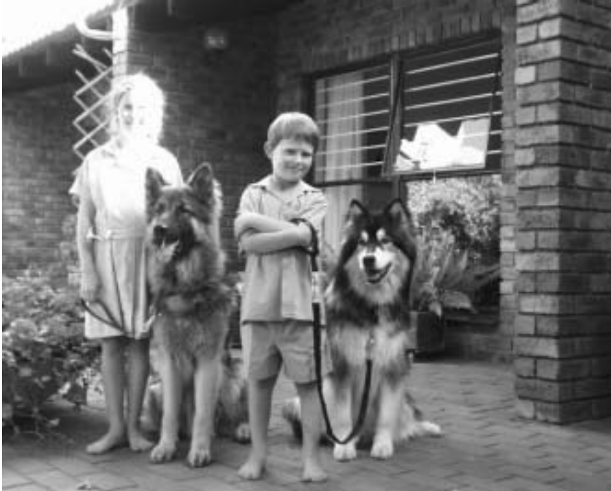
FOTO 2 Geselskapsdiere kan gevoelens van eensaamheid, vrees, verveeldheid en spanning verlig by kinders wat alleen tuis moet wees as gevolg van ouers wat voltyds werk