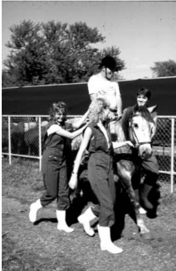
FOTO 11 Die algemene maatskaplike funksionering van die persoon word positief beïnvloed deur terapeutiese perdry

In 'n ondersoek deur Exner et al. (1994:18) om die effek van hippoterapie (terapeutiese perdry) by parapleë en kwadrupleë vas te stel is die volgende fisiese en psigiese voordele uitgewys: “...positive effects found relative to spasticity, certain pain syndromes, as well as contraction syndromes associated with impaired joint mobility... a number of associated effects were noted in the physiotherapy and, especially, the nursing sectors, easier catheterization, more rhythmical bowel function, more balanced mood with improved sleep, and generally increased openness and motivation”. McGibbon, Andrade, Widener & Cintas (1998:754-762) en Would (1998:51-58) bevestig ook die positiewe effek van terapeutiese perdry op die vlotheid van bewegings en growwe motoriese funksionering by