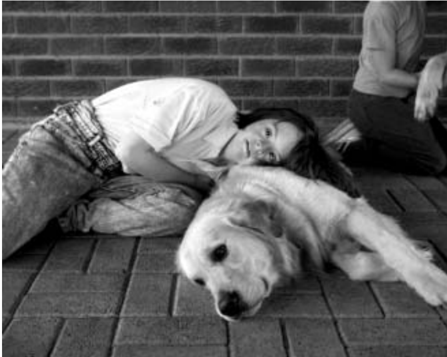
FOTO 14 Fisiese kontak is 'n belangrike komponent van die mens se emosionele ontwikkeling en geestesgesondheid

In 'n ondersoek deur Haughey, Milne & Elliott (1993:18&19) met psigiatriese bejaardes is bevind dat die teenwoordigheid van 'n hond tydens groepsessies lei tot 'n toename in sosiale interaksie. Soortgelyke resultate is verkry uit ondersoeke met langtermyn geïnstitutionaliseerde pasiënte deurdat die teenwoordigheid van geselskapsdiere fisiese aktiwiteit gestimuleer het, selfversorging bevorder het, ontrekkingsgedrag verminder het, oogkontak bevorder het, humor gestimuleer het asook 'n afname in gedisoriënteerde gedrag teweeggebring het (Bowes, 1991:5; Kalfon, 1993:19 en Zisselman, Rovner, Shmuelly & Ferrie, 1996:47-51). Resultate van 'n ondersoek gedoen deur Van der Walt (1996: 87&89) onder psigogeriatrisiese pasiënte in Weskoppies Hospitaal, Pretoria, sluit hierby aan en het getoon dat die teenwoordigheid van geselskapsdiere tydens groepsessies die volgende waarde gehad het: