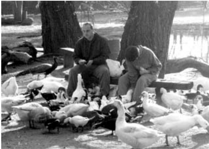
FOTO 19 Die behoeftes van daklose mense aan vriendskap, aanvaarding, nie-veroordeling en geselskap word nie altyd raakgesien nie