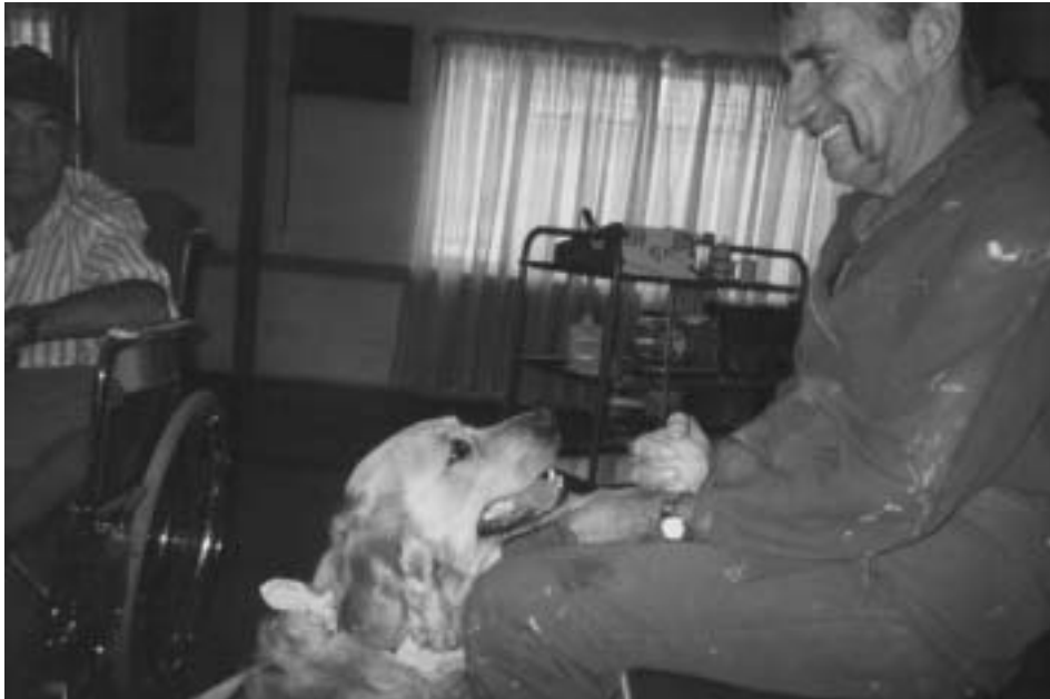
FOTO 1 Geselskapsdiere is nie inkongruent nie, hou nie 'n bedreiging in met fisiese aanraking nie, gee hul volle aandag en is altyd beskikbaar

Die eienskappe van geselskapsdiere wat deur Stewart (1996:9-11) uitgelig word, word vervolgens verder toegelig: