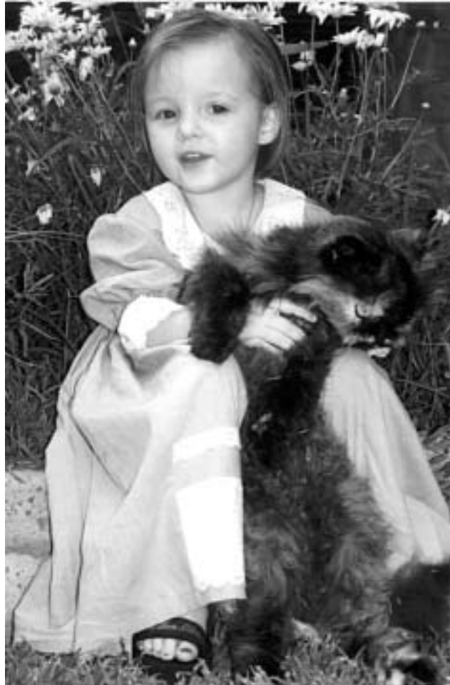
FOTO 8 Geselskapsdiere kan 'n belangrike substituuftfunksie vervul in die kleiner of onvolledige gesinsisteam in die sin dat hulle geselskap bied, 'n gevoel van veiligheid skep, 'n speelmaat kan wees en dus oor die algemeen eensaamheid kan verlig

Kindermishandeling en -verwaarlosing vind binne die gesinsisteam plaas en die omvang van geweld teenoor kinders in Suid-Afrika is omvangryk. In 1996 het alleen die Kinderbeskermingseenheid van die Suid-Afrikaanse Polisie diens 35 838 sake van misdaad teen kinders hanteer en Kindersorgverenigings het in 1998 gemiddeld 9 398 sake per maand hanteer (Mabetoa, 1998:10). (Vergelyk ook die Witskrif vir Welsyn, 1997:60.) Geweld in die vorm van fisiese mishandeling en seksuele molestering maak 23% van hierdie sake uit. Die positiewe identifisering van kindermishandeling is dikwels baie moeilik omdat die kind sal poog om homself en selfs die gesinsisteam te beskerm. 'n Hoë korrelasie (88%), bestaan tussen gesinsgeweld en dieremishandeling (Arkow, 1992:519 en Arkow, 1998:2). Die maatskaplike werker wat bewus is van die korrelasie tussen gesinsgeweld en geweld teenoor diere kan deur eksplorering van die mens–dierband toegang kry tot die aard van