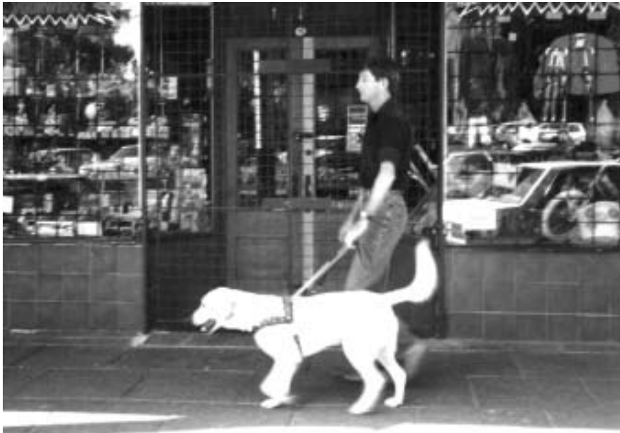
FOTO 10 Vir die gesiggestremde persoon strek die waarde van 'n gidshond veel verder as die onafhanklikheid wat dit bied

'n Verdere voordeel van geselskapsdiere, met spesifieke verwysing na dienshonde ('service dogs'), is dat hulle 24 uur beskikbaar is vir sowel fisiese as psigiese funksies en dus die gestremde die geleentheid bied om sover moontlik onafhanklik te funksioneer (Odendaal,1988:94). Daar is bevind dat die teenwoordigheid van dienshonde vir fisiesgestremde persone, onder andere persone met spierdistrofie, veelvuldige sklerose en traumatiese breinbeserings, die behoefte aan betaalde hulp met tot soveel as 72% verminder het. Die sekondêre voordele voortspruitend hieruit was 'n toename in eiewaarde, onafhanklikheid, integrering in die gemeenskap en lokus van kontrole (Duncan, 1998:255). Die koste-effektiwiteit van dienshonde is ook in die studie van Allen & Blascovich (1996:1001-1006) bevestig waarin daar 'n 68% afname in betaalde hulp en 64% afname in onbetaalde hulp onderskeidelik plaasgevind het as direkte gevolg van die teenwoordigheid van dienshonde. Hierdie ekonomiese waarde van geselskapsdiere is nie alleen van belang vir die gestremde en sy/haar gesin nie, maar ook vir die mediese fondsbedryf wat hierdie soort eise dek.