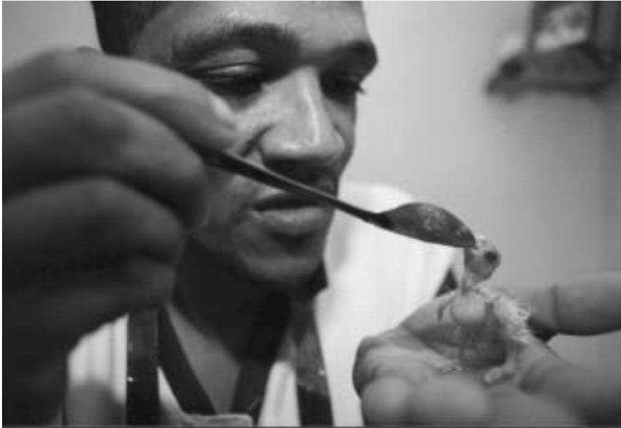
FOTO 5 Die versorging van geselskapsdiere leer die gevangene respek vir lewe