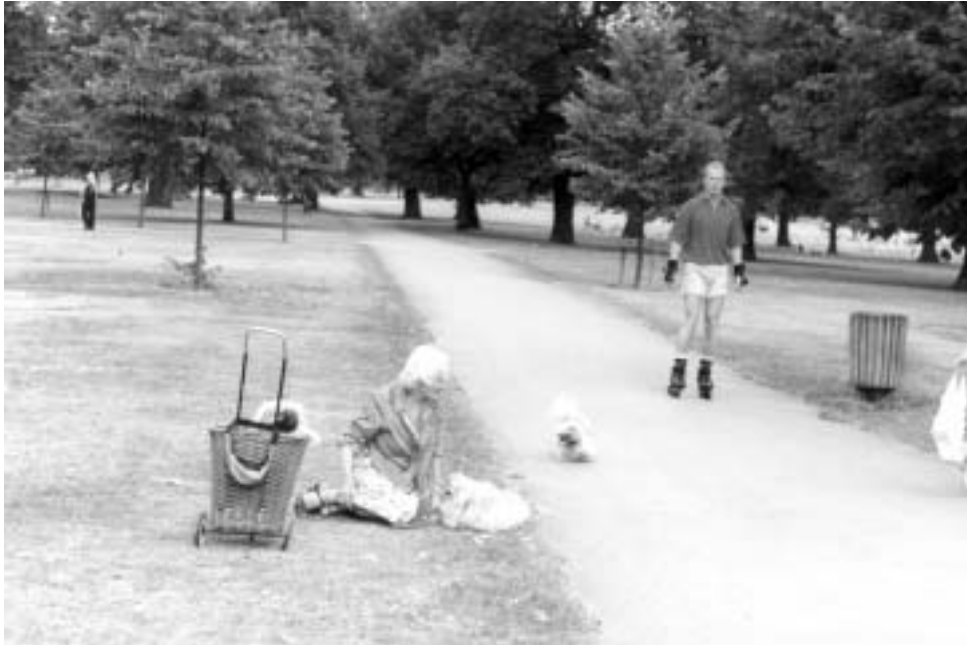
FOTO 3 Honde-eienaars neem meer dagstappies as nie honde-eienaars en is minder ontevrede met hul sosiale, fisiese en emosionele gesteldheid