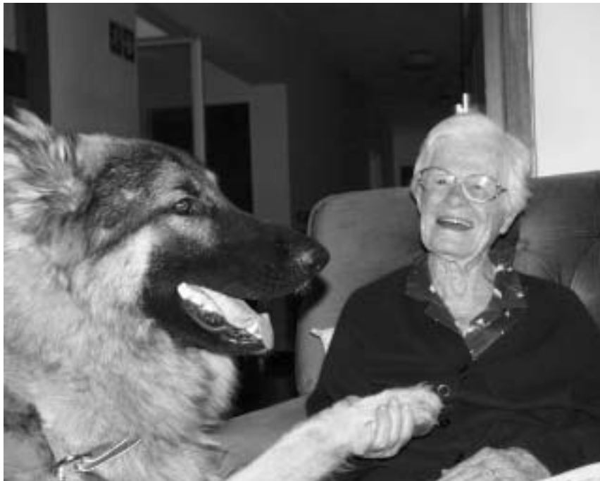
FOTO 12 Positiewe mens–dierinteraksie word gereken as een van die faktore wat lewenskwaliteit bevorder

Die geneeskundige maatskaplike werker funksioneer veral in hospitale en ander versorgingsinrigtings. Die volgende voordele van die benutting van geselskapsdiere in 'n hospitaal word deur Bernard (1995:95) uitgelig: