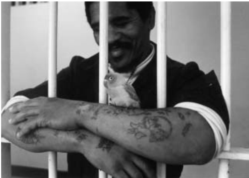
FOTO 6 Die positiewe interaksie met geselskapsdiere bevorder die gevangenes se eiewaarde en selfrespek

Die benutting van geselskapsdiere binne korrektiewe dienste, bied nie net voordele aan die gevangenes nie, maar kan ook 'n belangrike rol in die rehabilitasie en welsyn van diere speel en op die manier word gemeenskapsdiens bevorder. Whyham & Ormerod (1994:25) gee die volgende voorbeelde hiervan: