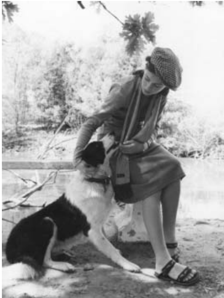
FOTO 7 Positiewe mens–dierinteraksie het veral waarde vir die ontwikkeling van die kind in die vroeë- en middelkinderjare