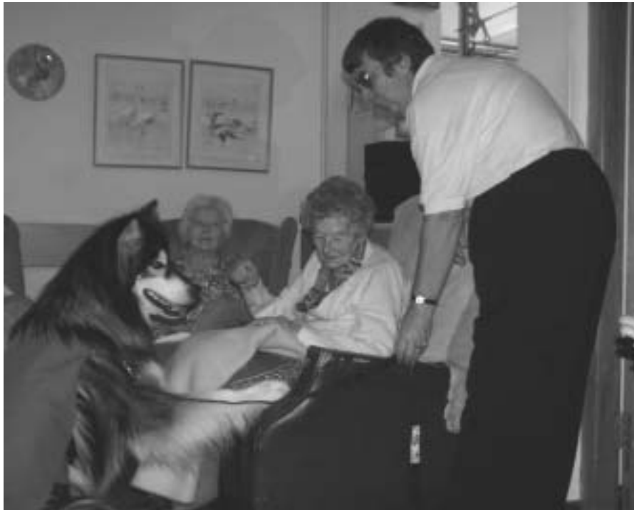
FOTO 4 Die teenwoordigheid van geselskapsdiere verhoog betrokkenheid van bejaardes by hul sosiale omgewing

'n Studie gedoen in 233 inrigtings vir bejaardes in Illinois, VSA, wat reeds van mens-dierinteraksieprogramme gebruik maak (Behling, 1993:7), het 85% aangetoon dat die programme 'n sielkundige voordeel vir die betrokkenes inhou en 66% het aangedui dat dit 'n fisiese voordeel inhou. Die belangrikste voordele wat genoem is, is die toename in sosiale interaksie en kommunikasie tussen die inwoners. Toename in betrokkenheid van bejaardes by hul sosiale omgewing in die teenwoordigheid van 'n geselskapsdier is ook in die studie deur Taylor et al. (1994:15) genoem. 'n Nadeel wat dikwels genoem word, is die tyd wat van personeel opgeneem word om die programme te implementeer. Indien die programme egter in spanverband aangebied word en ook vrywilligers betrek, kan dit op die langer termyn weer werklading verlig.