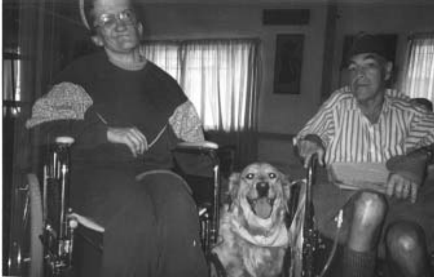
FOTO 9 Vir die gestremde persoon voldoen die geselskapdier aan die belangrike behoeftes van aanvaarding en respek, fisiese en emosionele interaksie, kommunikasie en sosialisering

Die teenwoordigheid van 'n hond by 'n gestremde moedig spontane kontak deur ander mense aan. Hierdie natuurlike kontak verbreek die gevoel van isolasie waarin die gestremde hom so dikwels bevind en bied ook geleentheid vir die nie-gestremde om te ervaar dat gestremdes, ten spyte van hul fisiese onvermoëns, 'n sinvolle lewe kan lei. Die feit dat geselskapsdiere geen vooroordele het ten opsigte van gestremdheid nie en die gestremde volkome aanvaar, bied waarskynlik die grootste psigologiese voordeel in hierdie verband. Vanweë die fisiese beperkings word gestremdes dikwels weerhou van gereelde interaksie met mense, sowel as dat hul gestrem word in die uitvoer van hulle daaglikse aktiwiteite.