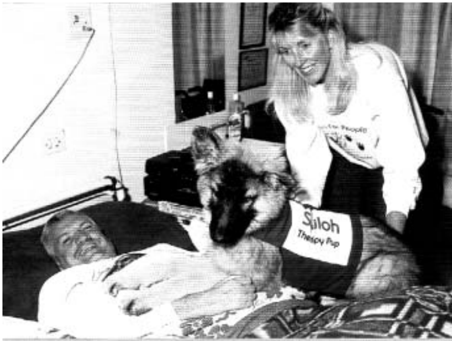
FOTO 13 Interaksie met die dier verminder die pasiënt se spanning en bied afleiding van pyn wat terapeutiese intervensie vergemaklik

Spanola (2000:13) verduidelik die waarde van positiewe interaksie tussen kinderpasiënte en geselskapsdiere soos volg: "Having a dog by their side can ease some of the pain when children are experiencing such difficult procedures as spinal taps. Some warm and friendly