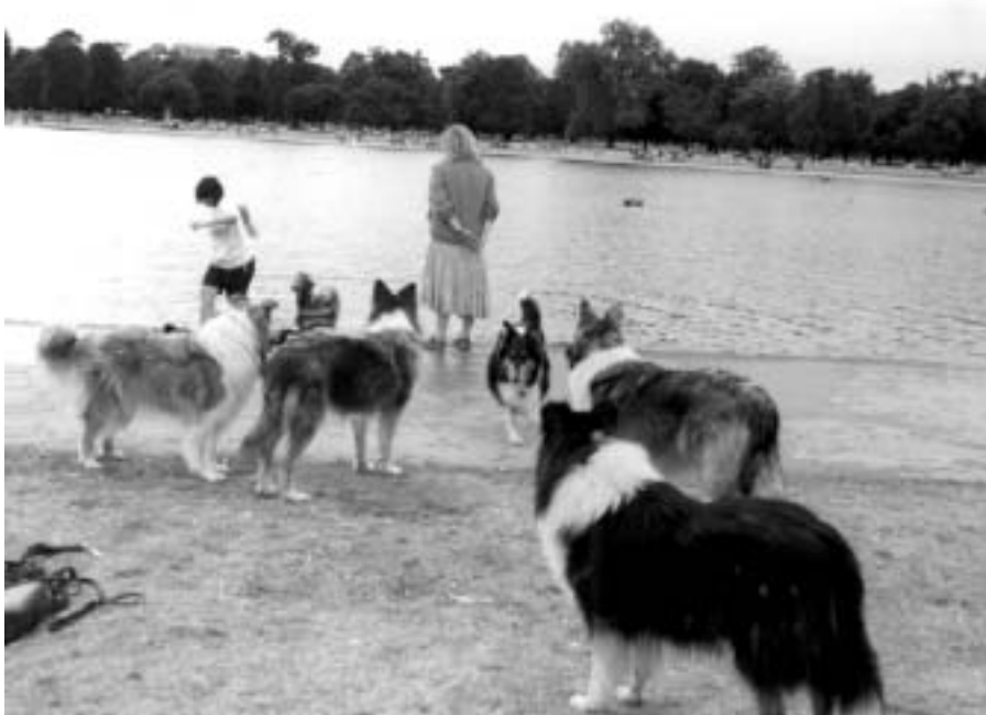
FOTO 16 Geselskapsdiere dien as skakel tussen mense, emosionele ondersteuner en nie-veroordelende vriend

Substansafhanklikheid strem die slagoffer daarvan op sowel fisiese-, psigiese-, emosionele- as sosiale vlak. Zastrow (2000:270) verwys na dwelmmisbruik as die: “...regular or excessive use of a drug when, as defined by a group, the consequences endanger relationships with other people, are detrimental to the user’s health, or jeopardize society itself”. Die afhanklike persoon is vasgevang in ‘n eensame, verdedigende, geïsoleerde, veroordelende en ongebalanseerde lewe. Die verlies van positiewe verhoudings in die gesin, gemeenskap, sosiale lewe en werkplek is waarskynlik die grootste enkele verlies waarmee die afhanklike persoon worstel. Die vermoë van geselskapsdiere om as katalisator, skakel tussen mense, bewonderaar, realiteitsobjek, emosionele ondersteuner en nie-veroordelende vriend te wees (Cusack, 1988:75-85 & Sable, 1995:339) kan as motiveerder in die proses van rehabilitasie dien. In die oë van ‘n geselskapsdier is sy eienaar altyd ‘n held, ongeag die verlede: “No matter what you look like, how everyone else perceives you, your animal does not care at all. You are always the hero even though you have lost the respect of everyone else in your world” (Stewart, 1996:9).