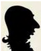
Lood se praatjies