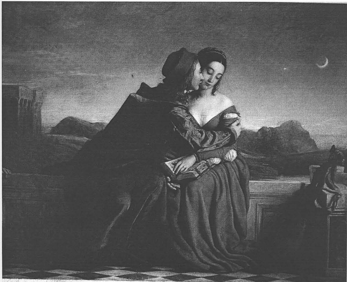
William Dyce: Francesca de Rimini

Opedra aan alle egpare wat in die huwelik glo en bereid is om alles te gee.