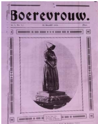
Figuur 40: Die eerste uitgawe van Die Boerevrou se voorblad.

Op die voorblad van die eerste uitgawe van Die Boerevrou (25 Maart 1919) het 'n swart en wit foto van 'n Anton van Wouw-standbeeldjie van 'n jongmeisie in Voortrekkerdrag verskyn. Die afbeelding is omraam en onderaan verskyn die woorde: "Ik sien haar win, want haar naam is – Vrouw en Moeder", aangehaal uit die digter Jan F.E. Celliers se gedig, By die Vrouebetoging . Dié afbeelding, in verskillende vorme, sou deur die volgende byna dertien jaar die tydskrif se embleem of kenteken word en die aanhaling uit Celliers se gedig, 'n kernspreuk of leuse, wat die gees en bedoeling van die tydskrif moes aandui. 'n Kop-en-skouer sketsie van die beeld in 'n ovaal raampie het ook gereeld bo-aan bladsye van die tydskrif verskyn.