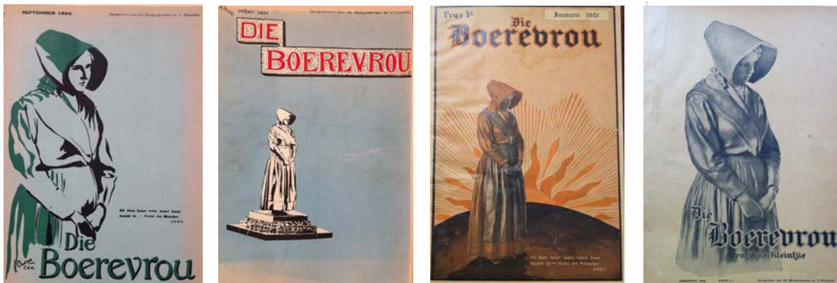
Figuur 46: Nog voorbeelde van verskillende voorblaie van Die Boerevrou .

Sommige lesers was egter weer van mening dat die verandering van die voorblad nie drasties genoeg was nie en het ook nie geskroom om hul menings te lug nie. Verskille oor die voorblad het in 1923 'n hoogtepunt bereik toe mev. J.S.J. in Februarie voorgestel het dat daar reguit gesels word oor die voorblad in Om die Koffietafel , die korrespondensiekolom. 798 Die briewe het ingestroom. Die redaksie het besluit om twee pryse in die vorm van teelepeltjies uit te loof vir die beste briewe en voorstelle oor die onderwerp. Die briewe wat ontvang is, kan in twee groepe verdeel word. 799