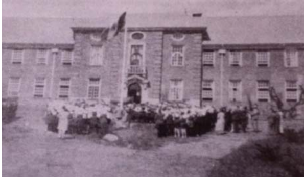
Figuur 49: Die skoolgebou van Die Afrikaanse Hoër Meisieskool met die amptelike opening in 1930.