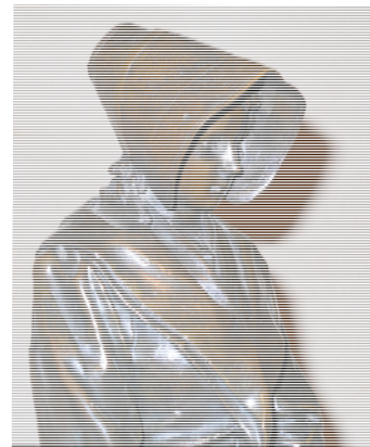
Figuur 41: Die Noitje van die onderveld. Nasionaal Kultuurhistoriese Museum, Pretoria.