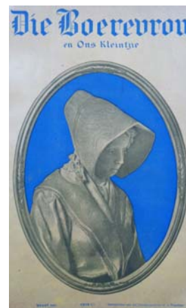
Figuur 51: Die skoolwapen van die Afrikaanse Hoër Meisieskool, Pretoria Uit: R. Pretorius, Ek sien haar wen! (Pretoria, 1996), voorblad.