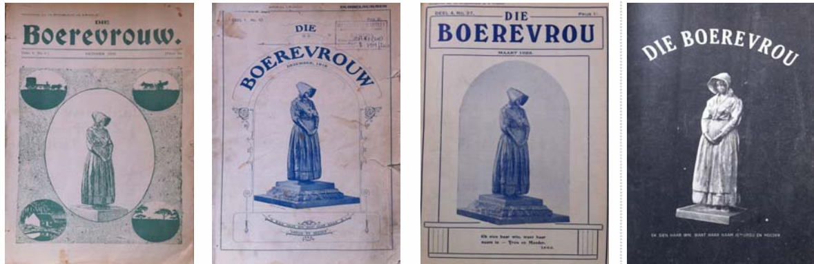
Figuur 45: Voorbeelde van verskillende voorblaie van Die Boerevrou .

Sommige lesers was egter weer van mening dat die verandering van die voorblad nie drasties genoeg was nie en het ook nie geskroom om hul menings te lug nie. Verskille oor die voorblad het in 1923 'n hoogtepunt bereik toe mev. J.S.J. in Februarie voorgestel het dat daar reguit gesels word oor die voorblad in Om die Koffietafel , die korrespondensiekolom. 798 Die briewe het ingestroom. Die redaksie het besluit om twee pryse in die vorm van teelepeltjies uit te loof vir die beste briewe en voorstelle oor die onderwerp. Die briewe wat ontvang is, kan in twee groepe verdeel word. 799