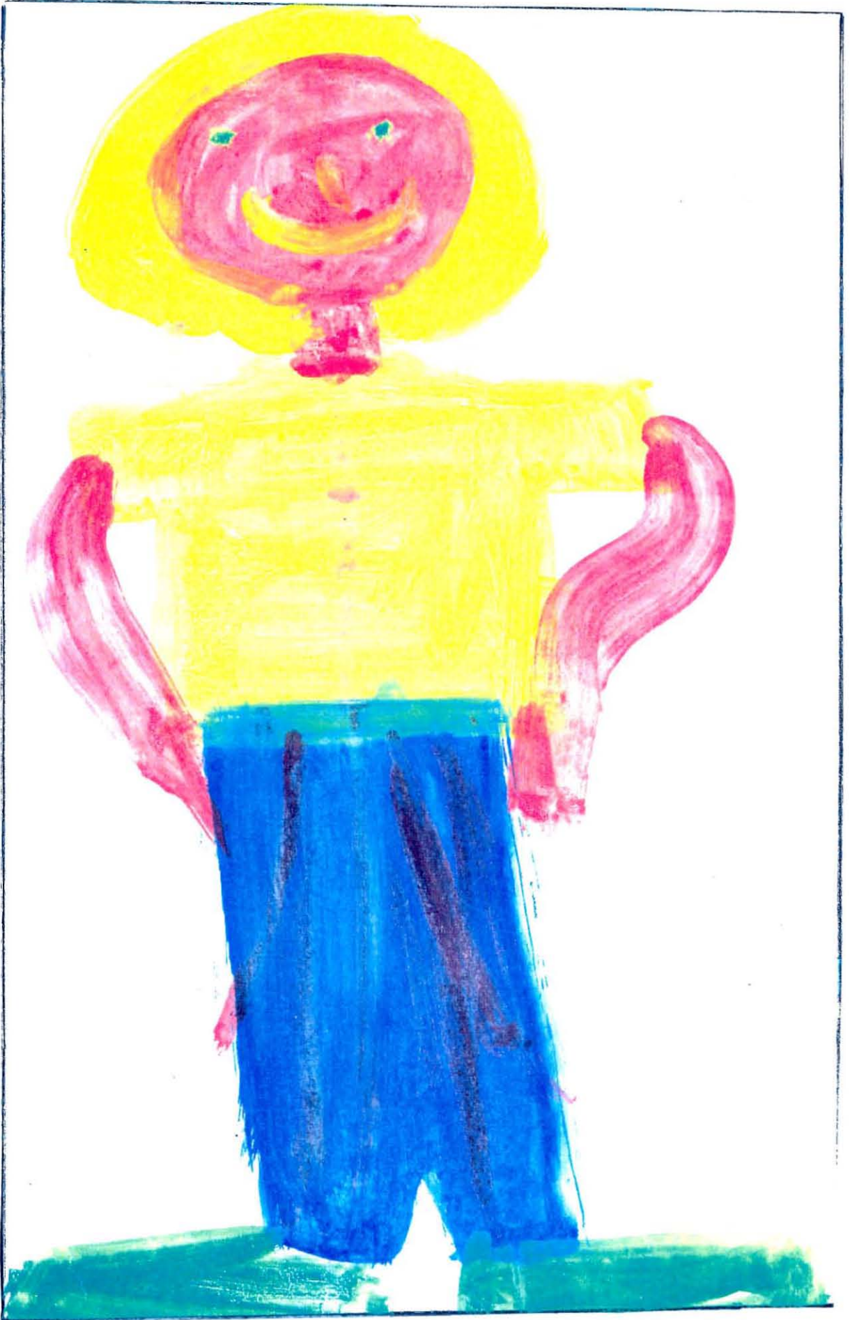
FIGUUR 5.8 DIE STERK MAN