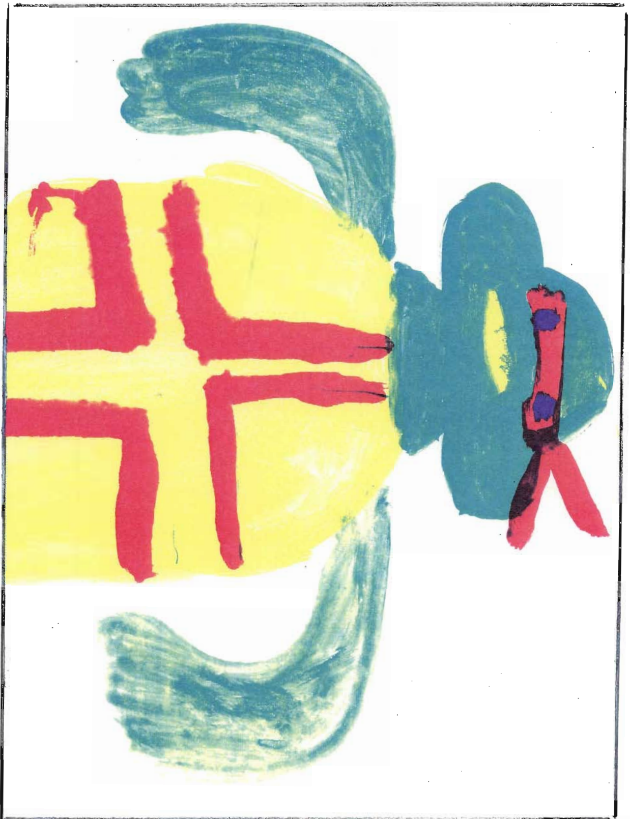
FIGUUR 5.7 DIE "TURTEL"