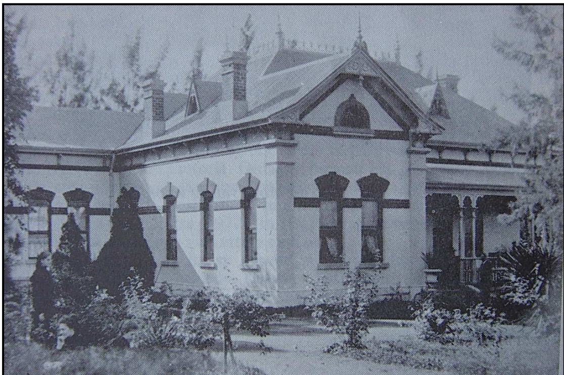
Die mooi woonhuis van die De Rappergesin, Cellierstraat 57 [Pr-83, p10]