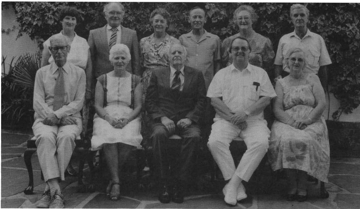
Die bestuur van die Pretoriase Historiese Vereniging: Genootskap Oud-Pretoria The executive committee of the Pretoria Historical Association: Old Pretoria Society