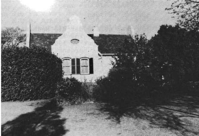
Woonhuis van Mnr. W.M. Pattison te Pretoria, ontwerp deur J.R. Burg.