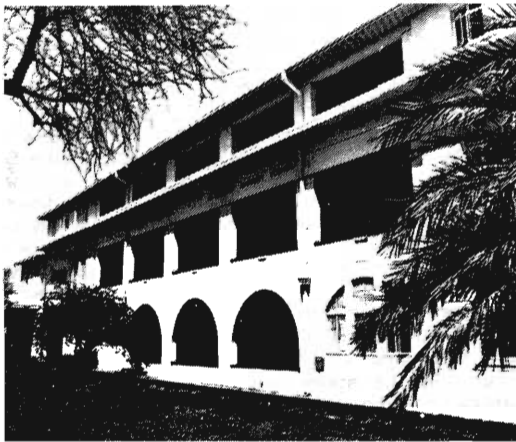
Gebou van die Ou Moedersbond te Pretoria, ontwerp deur J.R. Burg en voltooi in 1933.