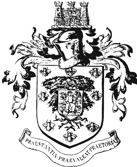
Drawing 6 Draft by the College of Arms in London of a Coat of Arms for Pretoria, with crest and mantling, but without supporters, 1907.