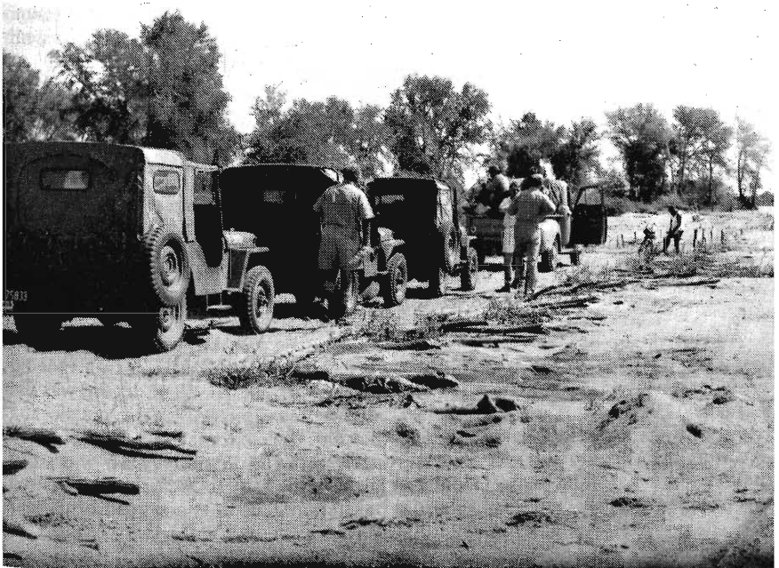
Oor die Limpopo terug by Mapai in Mosambiek