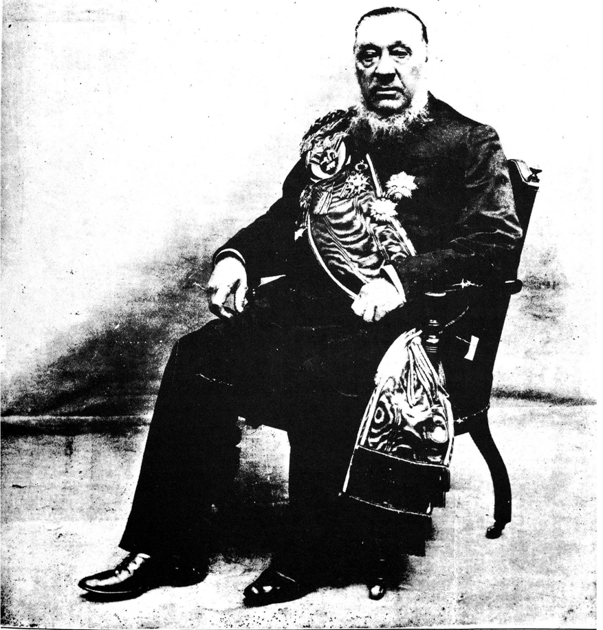
THE LATE EX-PRESIDENT KRUGER wearing his Insignia of Office.