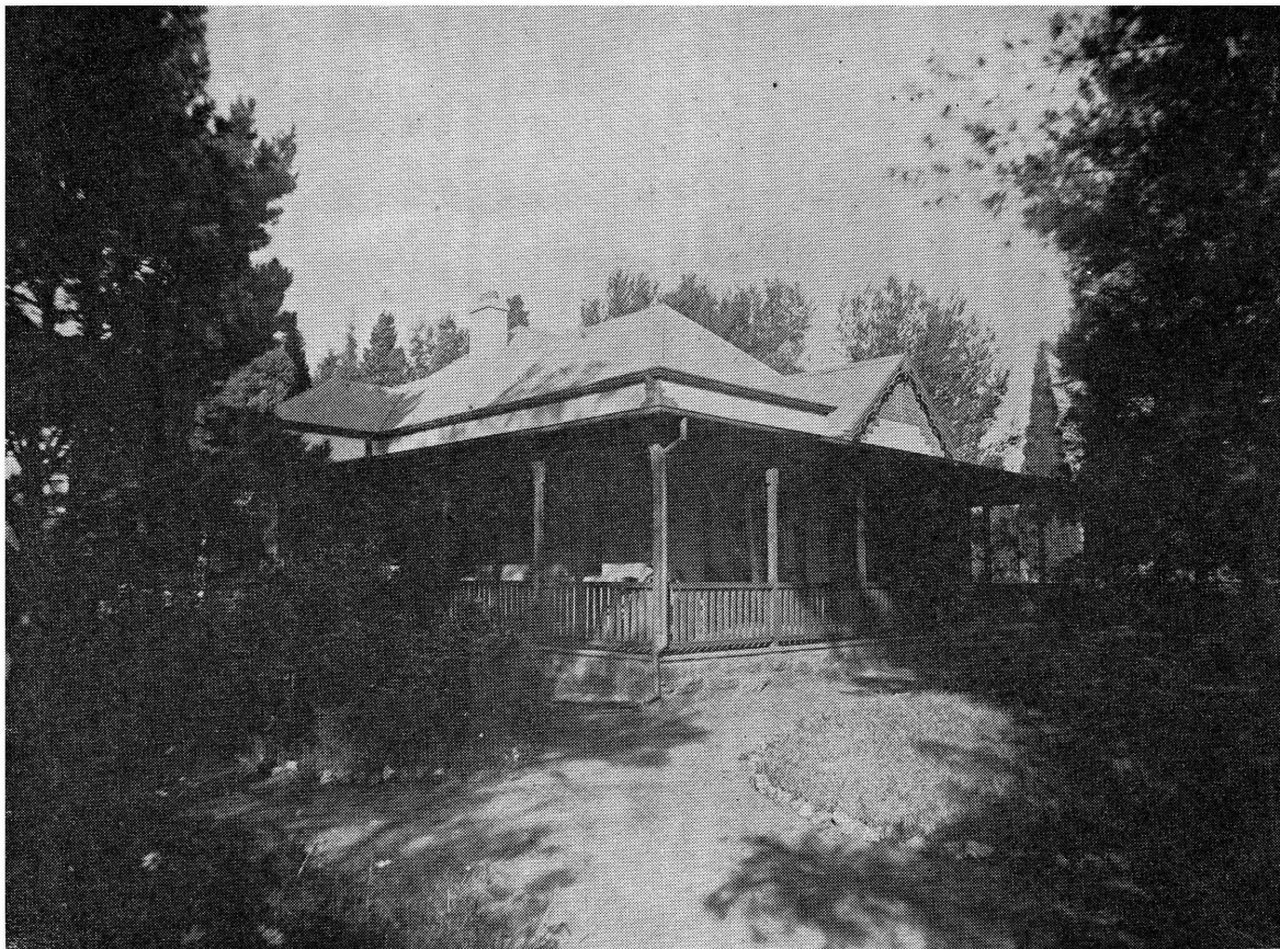
DIE HUIS VAN JAN CELLIERS