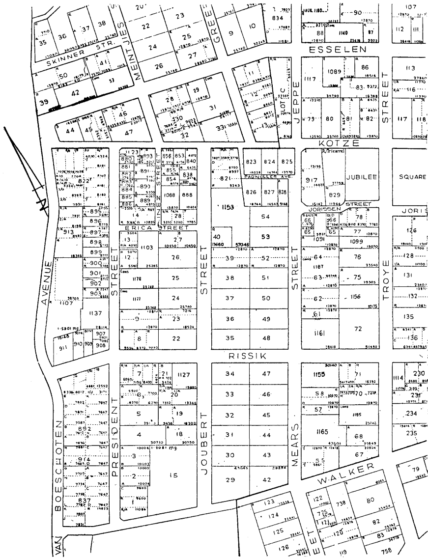
Kaart van gedeelte van Sunnyside met strate en erfnummers.