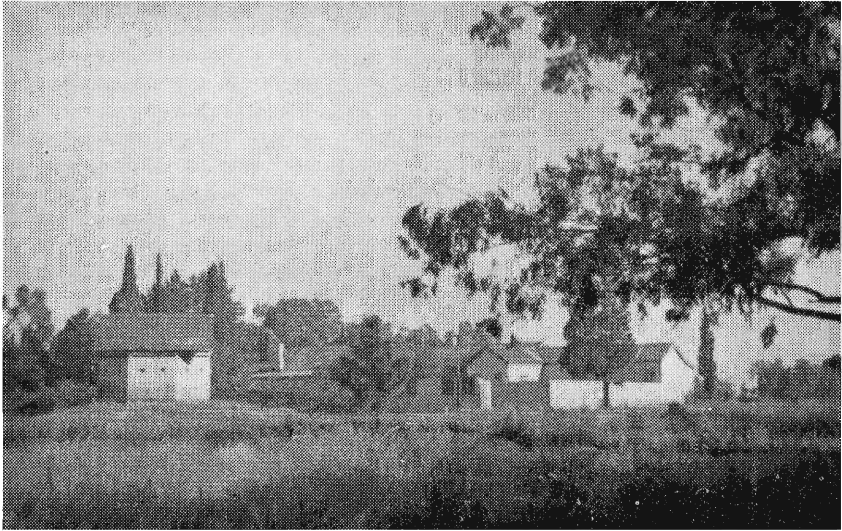
Verdedigingspos en Uitkyk buite „District House”, die woonhuis vir belangrike militêre persoonlikhede.

fasiliteite in Pretoria-Wes minder genoegsaam geword het. 'n Hospitaal is aangebou vir die verpleging van die talle gevalle van malaria en influënsa wat voorgekom het, 'n gimnasium wat vandag nog deur die S.A. Militêre Kollege as sodanig gebruik word, is opgerig, waar sosiale funksies en selfs kerkparades Sondae gehou is, en feitlik op elke gebied is daar voorsiening gemaak vir geboue. Geleidelik is baie van hierdie geboue verkoop aan die S.A.S. & Hawens, S.A. Polisie en die Gevangeniswese, talle ander is gesloop en die bruikbare materiaal gebruik vir die oprigting van geboue vir krygsgevangenes net na Wêreldoorlog I. Ander is gebruik om geboue by die Swartkop-lughawe op te rig. Al die geboue by Kwaggapoort is oorgeplaas na die Department van Publieke Werke, vir verkoping aan die S.A. Polisie. Van daardie geboue is vandag nog in gebruik.