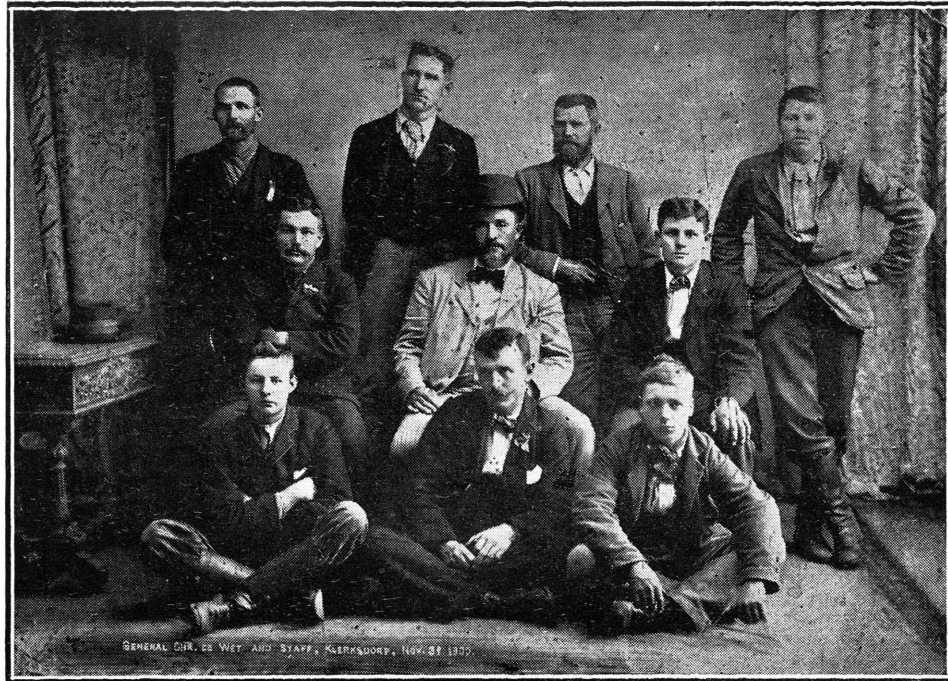
LYFWAG VAN GENL. DE WET, AFGENEEM NOVEMBER 1900.