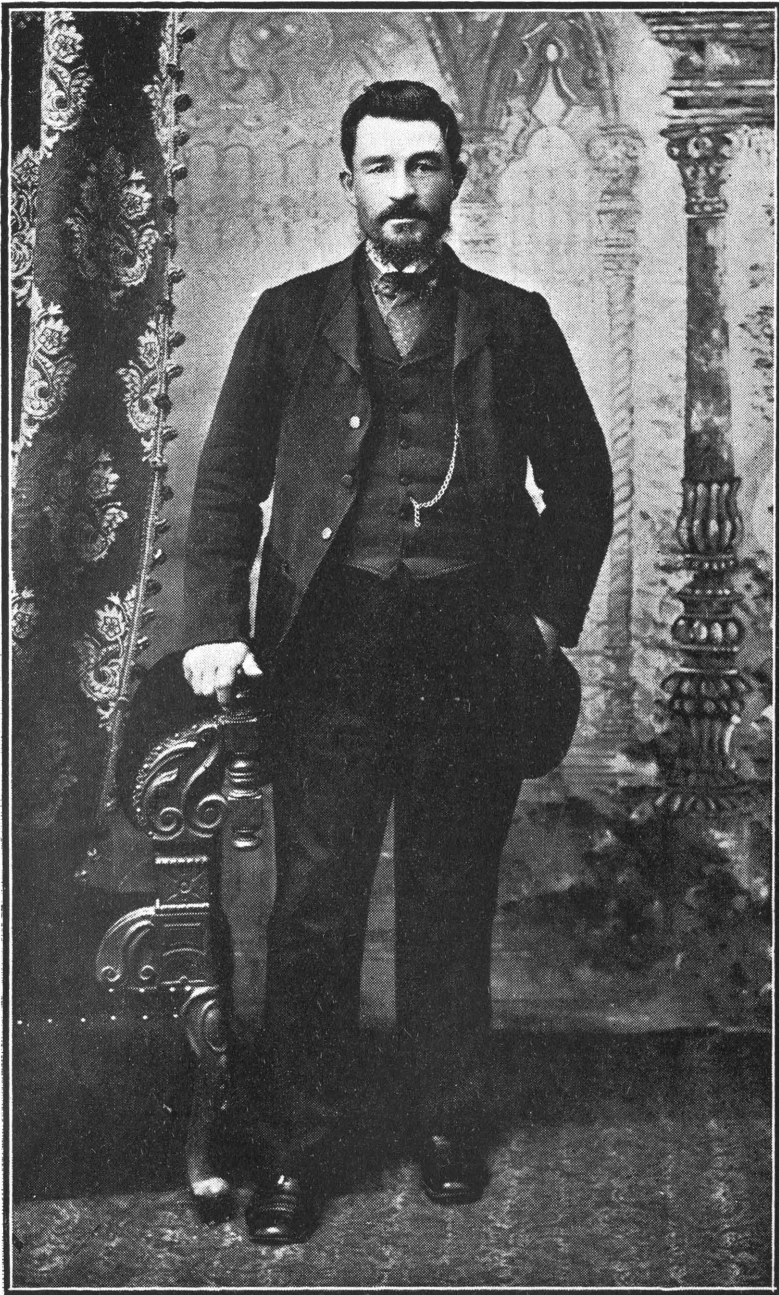
CHRISTIAAN DE WET, BEGIN VAN DIE OORLOG 1899—1902.