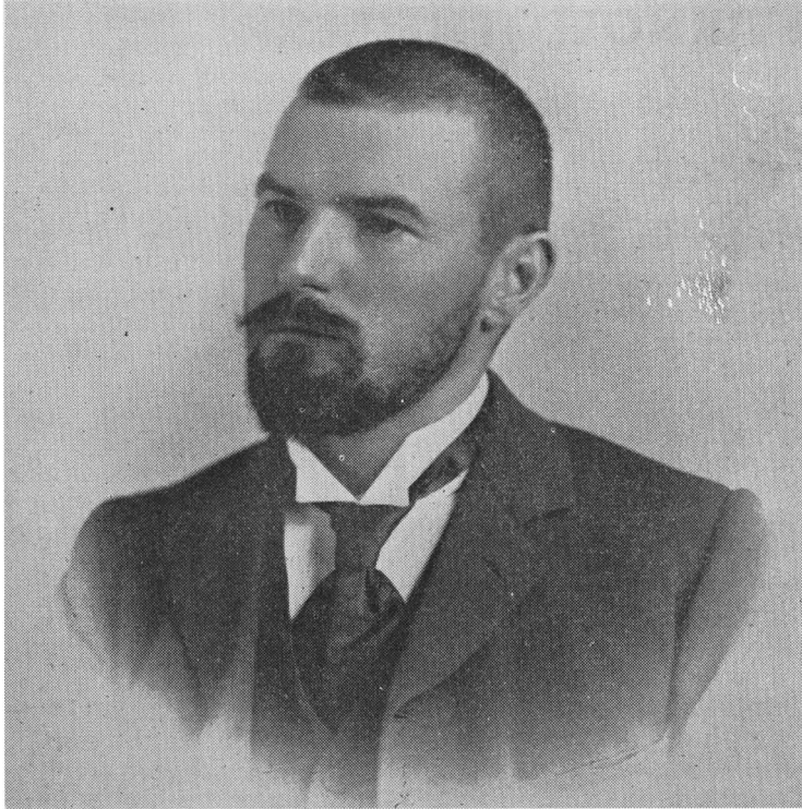
Dr. Arnold Theiler, Staatsveearts in diens van die S.A. Republiek.

Met elke myl wat die skip aflê, neem my vertroue in 'n goeie toekoms toe. God help die moedige dus voorwaarts." Van 'n Afrikaner aan boord verneem hy dat daar wel veeartse in Johannesburg is maar aangesien hulle nie goed opgelei is nie, kan hy hom gerus ook daar vestig. Dit laat hom ewewel twyfel of hy in hierdie stad moet gaan woon.