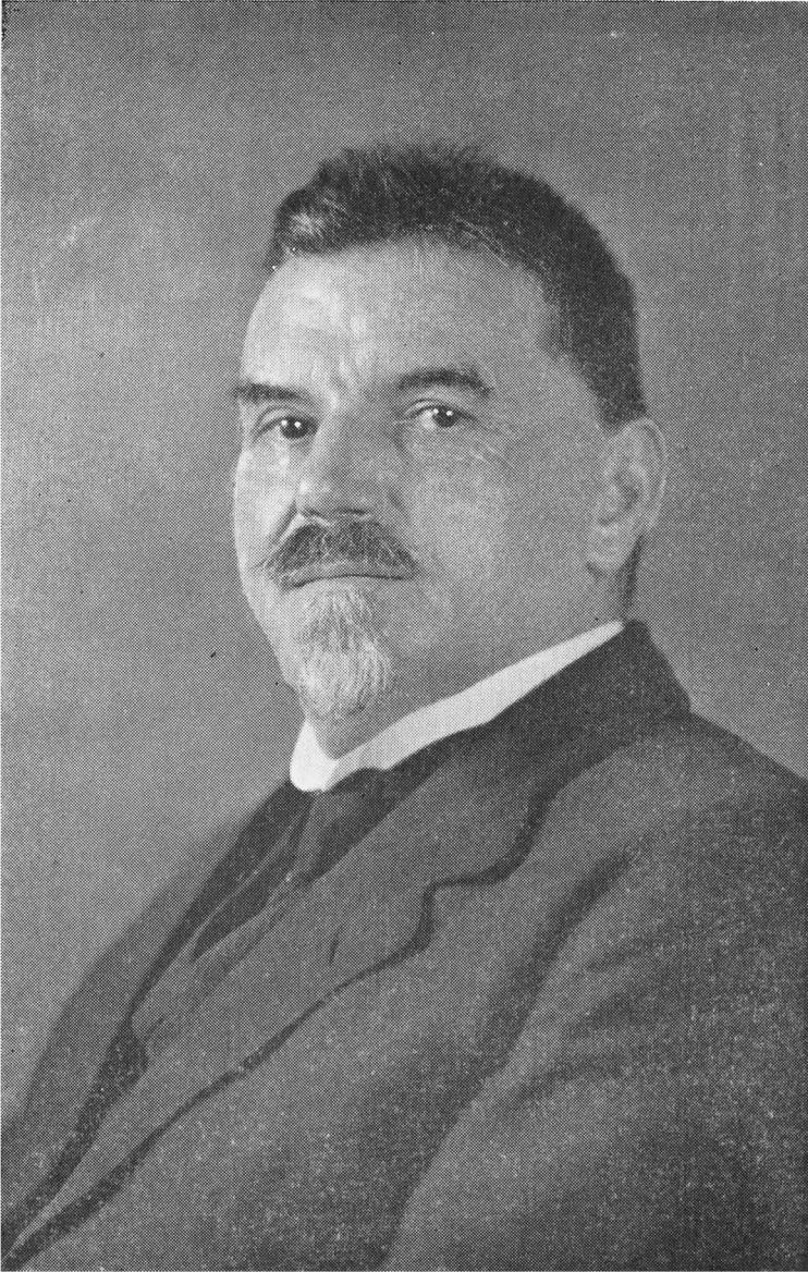
Dr. Arnold Theiler op 60-jarige leeftyd.