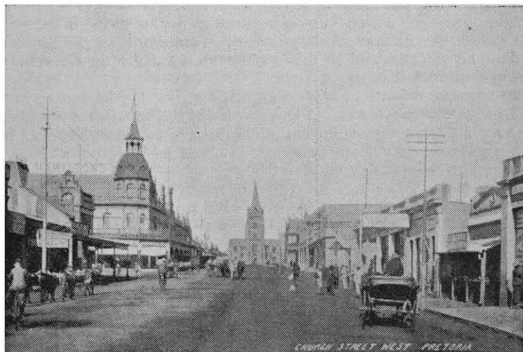
CHURCH STREET EAST, PRETORIA. ± 1906

Since the early years of this century the face of Pretoria has undergone tremendous and irrevocable changes. Town planning should however not take place divorced from aesthetical and historical necessities.