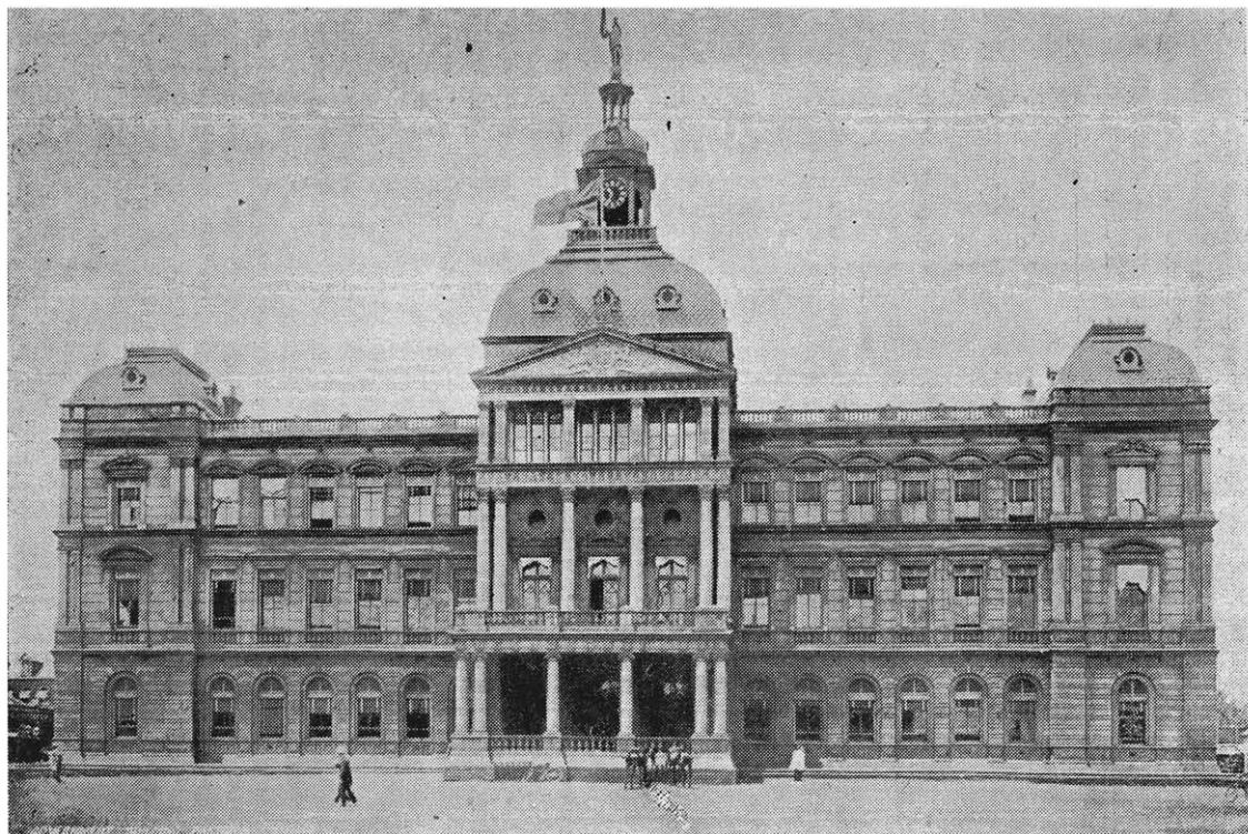
DIE STAATSGEBOU, ± 1904. LET OP DIE PERDE VOOR DIE GEBOU