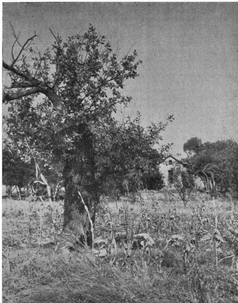
Hierdie ou akkerboom is omstreeks 1871 deur eerw. Knothe geplant. Op die agtergrond tussen die bome kan 'n gedeelte van die ou sendinghuis gesien word,