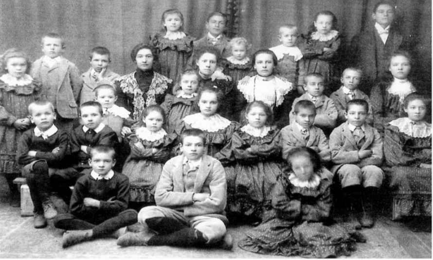
Figuur 3: Vier en twintig weeskinders wat as inspirasie vir die stigting van die CNO-skool in die kelder van die NG Kerk (Klipkerk) op Heidelberg gedien het.