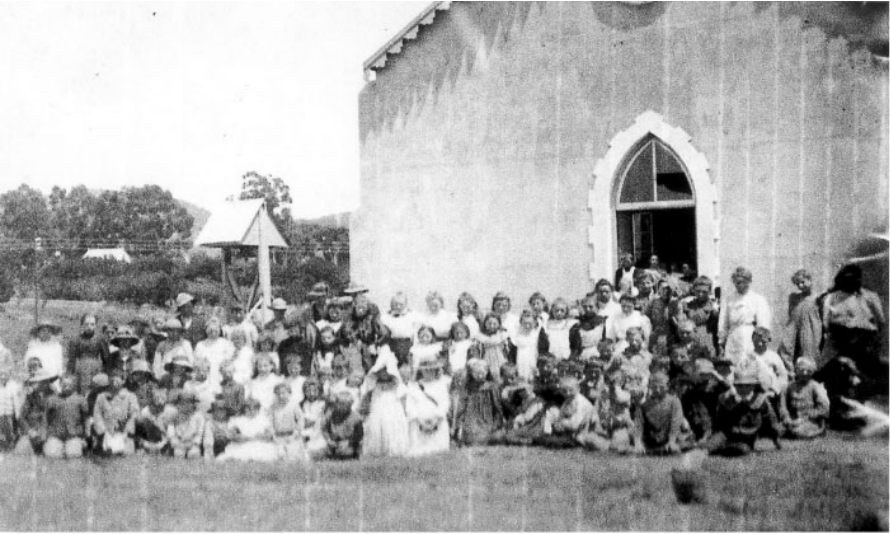
Figuur 1: Die Gereformeerde Kerkgebou op Heidelberg het in 1901-1902 as kampskool vir ongeveer 250 konsentrasiekampkinders gedien.