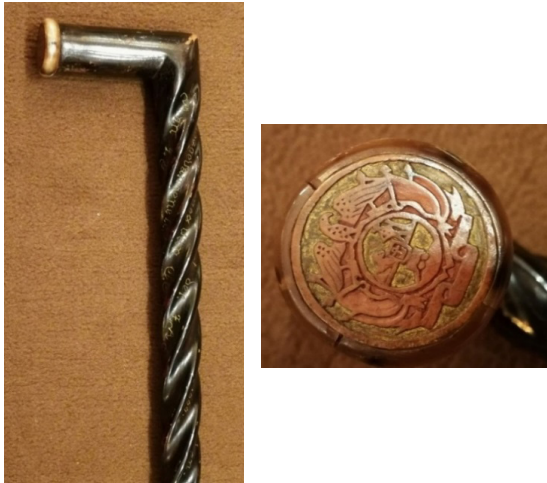
Figuur 7: Die Transvaalse wapen verskyn op die punt van die handvatsel en die inskripsie “Aan ZAR SJP Kruger Staatspresident der ZAR. Gedachtenis van CF en MJ Vermeulen kreigsgevangene te St. Helena 10 Oktober 1900” is op die steel gegraveer