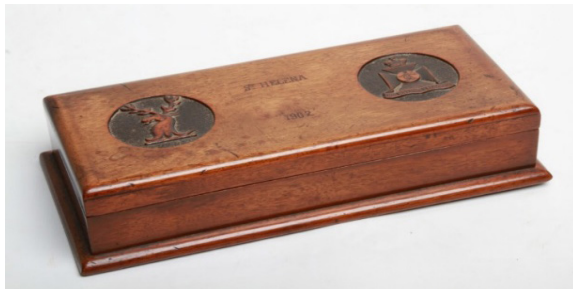
Figuur 9: 'n Kissie met regimentwapens in sirkels daarop uitgekerf vir 'n Britse soldaat, met die inskripsie "Made by HT Siglé POW" aan die binnekant van die deksel