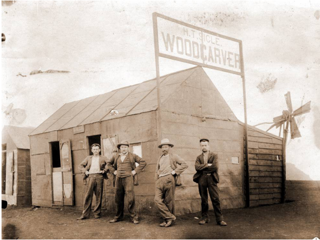
Figuur 3: Krygsgevangenes voor HT Siglé se werkswinkel in die Deadwood-kamp. Die windmeule wat die draaibank binne-in die gebou met windkrag aangedryf het, is duidelik sigbaar by die regterkantste hoek van die gebou

nuwe wending aan die kwantiteit en kwaliteit van produksie verskaf. Spoedig was daar ses windmeulens met draaibanke in die Deadwood-kamp aanwesig. 34