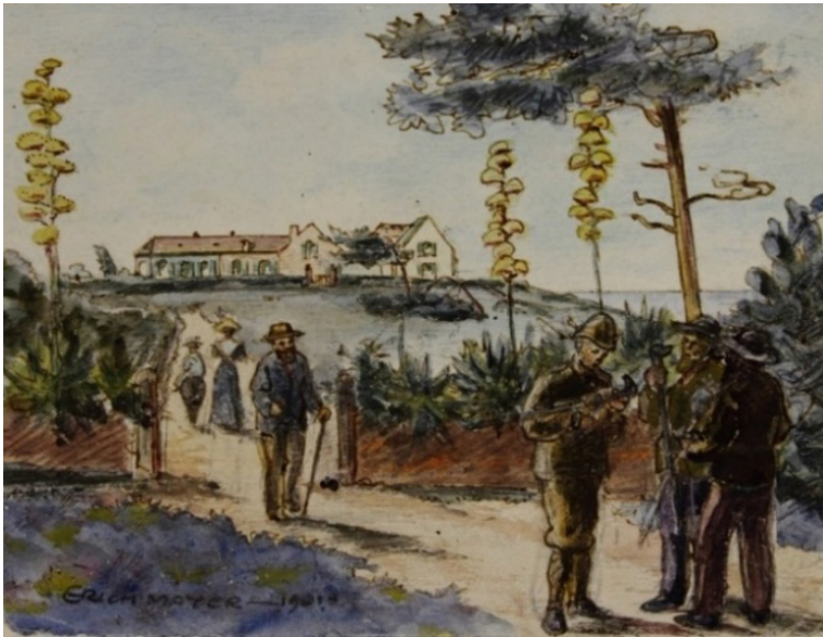
Figuur 11: ‘n Waterverfskets deur Erich Mayer in 1901 op St. Helena van ‘n Britse soldaat wat as potensieële koper besig is om ‘n handgemaakte kierie te inspekteer

Kotzé skryf dat die krygsgevangenes op St. Helena al hoe meer krygsgevangenekuns begin vervaardig het, wat hulle dan aan die eilandbewoners en veral die Britse offisiere verkoop het. Die soldate wou graag van die curiositeite aan hulle vriende en familie stuur wat al so baie van ‘The Boers’ in die koerante gelees het. 112 Schumann skryf dat die krygsgevangenes op St. Helena tydens hul parool ‘n kleinhandelsooreenkoms met die eilandbewoners aangegaan het waartydens hulle onder meer vrugte en groente vir Boerekrygsgevangenekuns geruil het. Hy maak ook melding daarvan dat die aanvanklike winsgewendheid later gekwyn het en die verkope begin afneem het, omdat die eiland baie klein en die bevolking nie baie welvarend was nie. 113 Die krygsgevangenes het veral ook onder mekaar handel gedryf en handwerk is oor en weer verkoop of geruil. 114