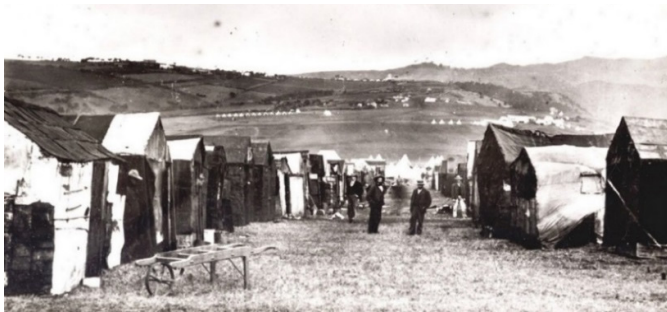
Figuur 1: Die Deadwood-krygsgevangenekamp (Blikkiesdorp), St. Helena

Twee primêre kampe is op St. Helena opgerig, naamlik Deadwood en Broadbottom. 5 Deadwood is eerste aangelê op 'n boomlose en winderige plato. Daar was 11 rye met 15 tente in elke ry, dus 'n totaal van 165 tente wat elkeen 12 man gehuisves het. Die beknopte toestande het later veroorsaak dat die kampowerheid toestemming aan krygsgevangenes verleen het om hutte te bou met enige boumateriaal wat hulle in die hande kon kry. onder meer olieblieke, sakke en bamboes. Dié gedeelte van die kamp het spoedig bekend gestaan as Blikkiesdorp. 6