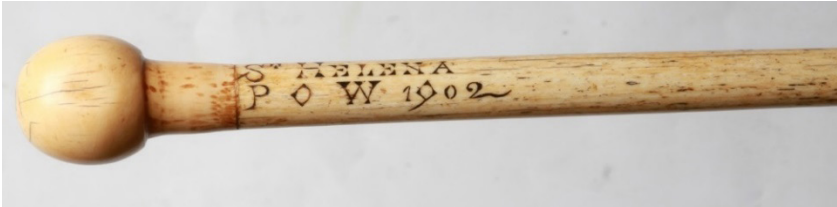
Figuur 4: 'n Kierie van walvisbeen met 'n geronde knop as handvat en die bewoording "St. Helena, POW, 1902"

van voorwerpe uit been en ivoor. 66 Die ivoor waarna verwys word, is waarskynlik groot vis- en walvstande wat hulle by die eilandbewoners verkry of gekoop het en dan in pragtige dosies en borsspelde verwerk het. 67 In September 1901 verskyn daar 'n berig in die Haarlem's Dagblad van 28 September 1901 dat FC Versélewel de Witt Hamer 'n nuwe besending krygsgevangenehandwerk vanaf St. Helena ontvang het, onder meer voorwerpe kunstig vervaardig uit walrustande. 68