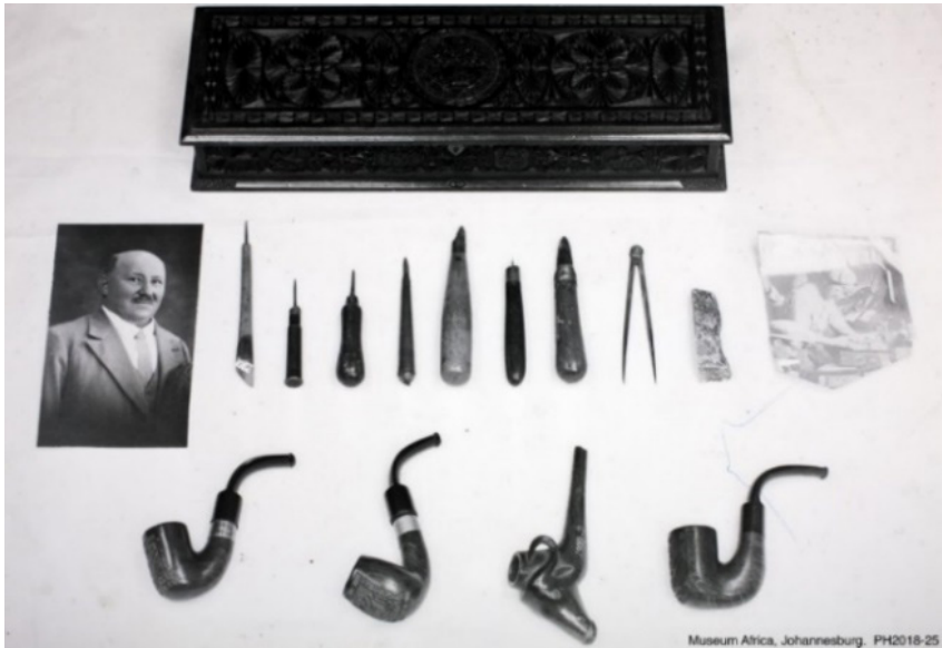
Figuur 2: Die selfgemaakte gereedskap wat deur HT Siglé (foto links) gebruik is tydens sy krygsgevangenskap op St. Helena vir reliëfkerfwerk op kissies en pype