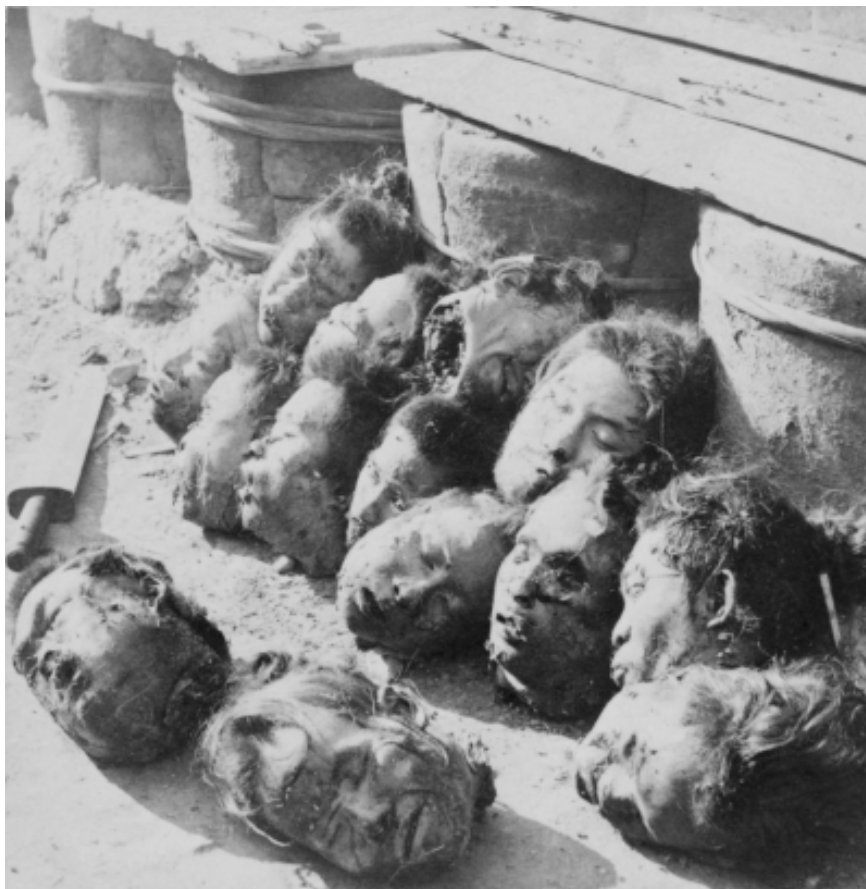
Figuur 1. Die agtergrond en omstandighede van hierdie onthoofdings is onbekend.

Kan daar 'n meer grusame of wrede manier wees om te sterf as onthoofding (Figuur 1)?