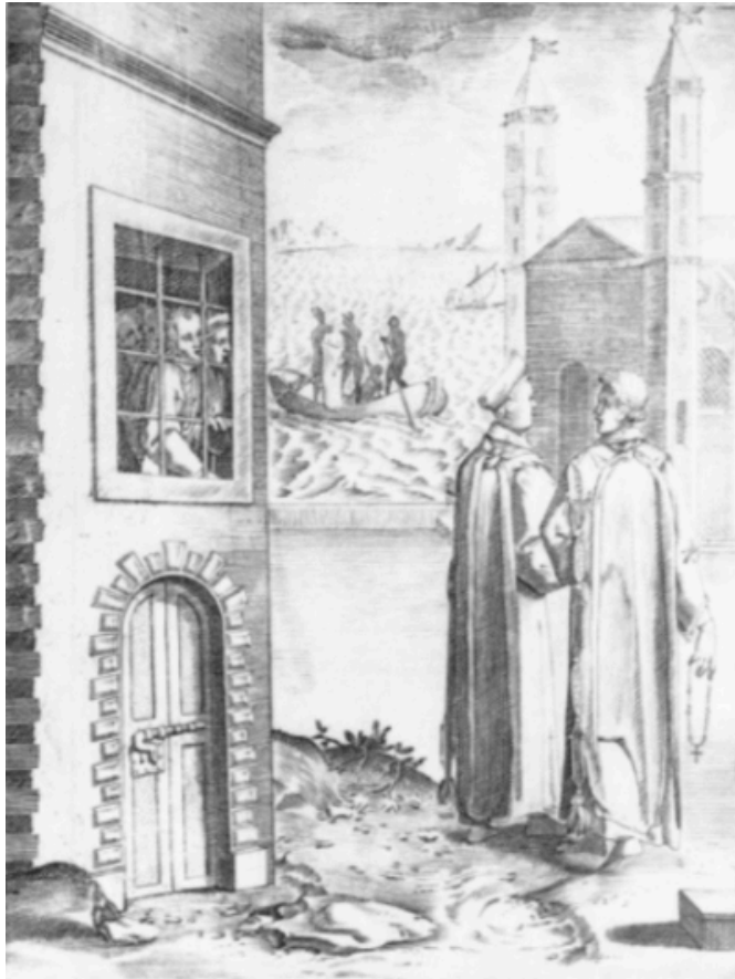
Figuur 5. De prohibitionibus et poenis , illustrasie van Statuut XVIII, deur Philippe Thomassin (Stone, 1997:165)

Alle Ridders sou dus onmiddellik Caravaggio se bron herken het (Stone 1997:165). Aan die regterkant, uitgebeeld as “twee torings” van deugszaamheid, staan twee trotse Ridders met formele klede. Aan die teenoorgestelde kant van die plaat is hulle dwalende teenhangers. Hulle dra steeds die Kruis, maar staar swarmoedig deur die tronkvensters. Hulle desperaatheid is te verstane, sê Stone (1997:165–6): Op ’n boot, in die middel van die agtergrond, ontvang een van hulle selmaats die algemene straf vir moord (soos voorheen gemeld). Hy word naamlik vasgebind en in die see gegooi (Stone 1997:166; Graham-Dixon 2010:370).