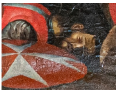
Figuur 11. Detail van Figuur 8