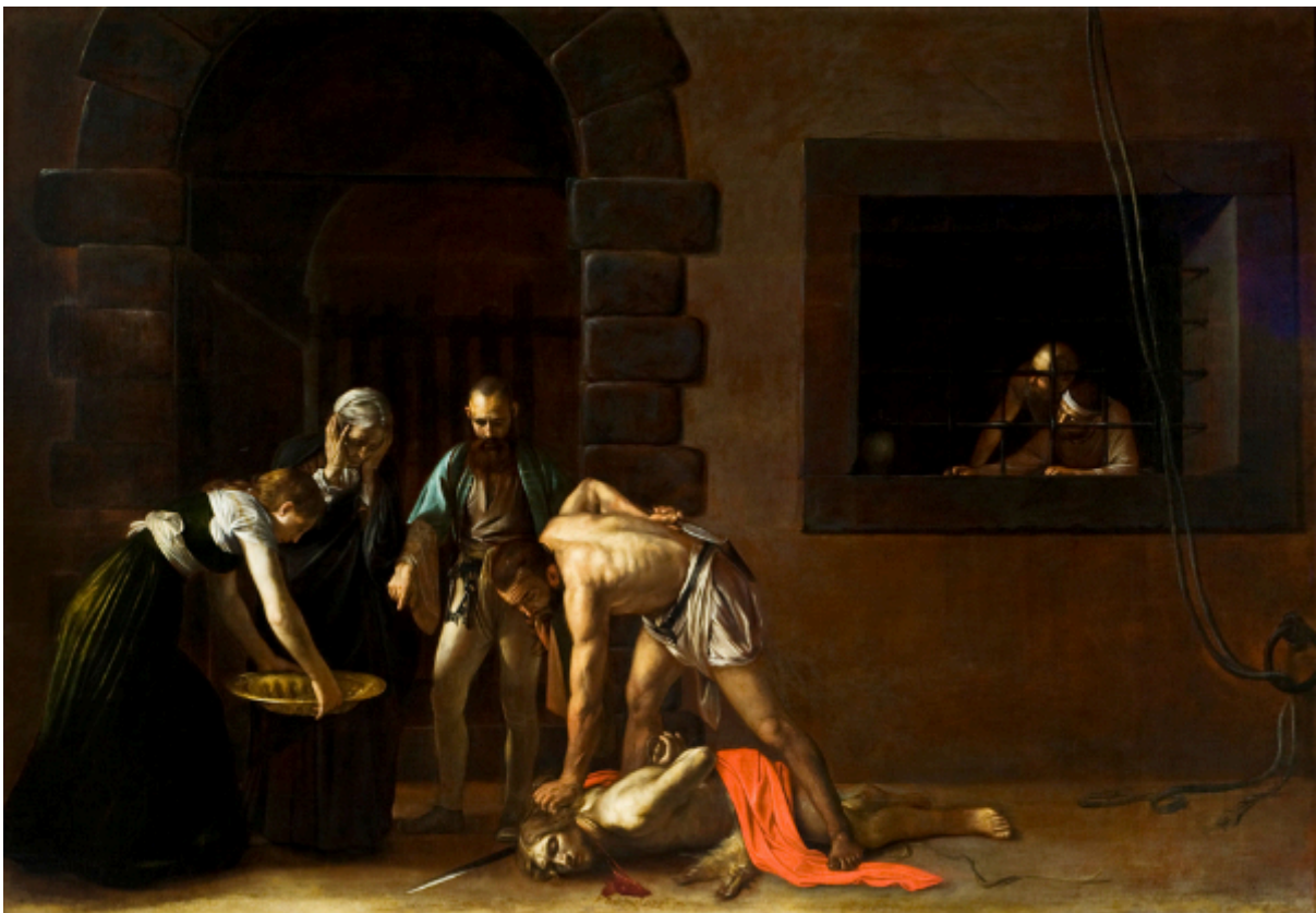
Figuur 9. Die onthoofding van Sint Johannes die Doper. Caravaggio. 361 cm x 520 cm. Medekatedraal van Sint Johannes, Valletta (Stone 1997:163 Wikimedia Commons)

Die skildery in Figuur 8 is die werk van 'n ongeïdentifiseerde kunstenaar en is 'n uitbeelding van die martelaarskap van die lede van die Orde tydens die oorname van Fort Sint Elmo gedurende die hoogtepunt van die Beleg (Stone 1997:167). Die Madonna, die Kind en Sint