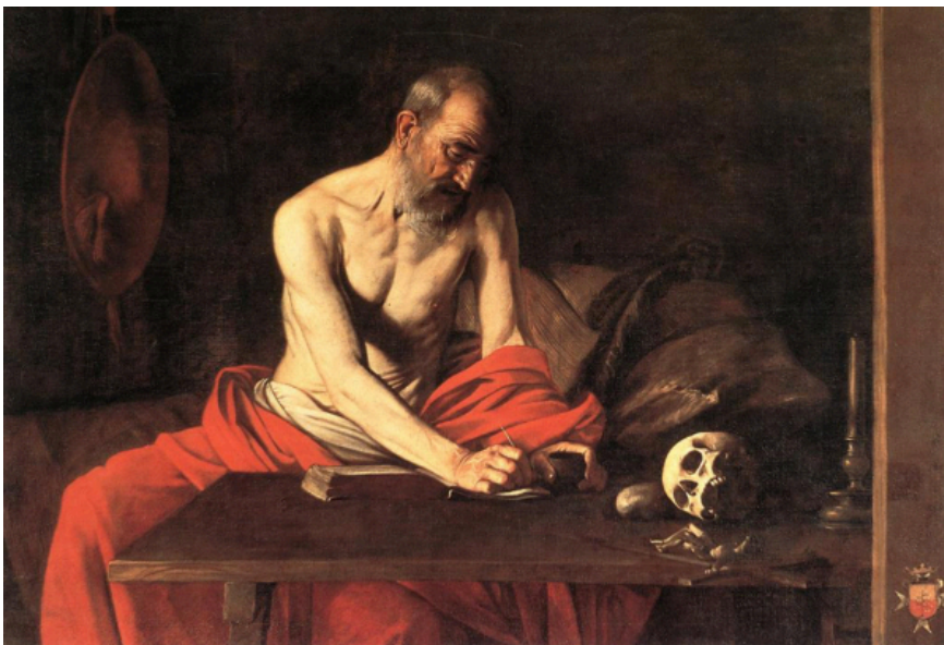
Figuur 3. Sint Hieronymus wat skryf. Caravaggio, Oratorium van S. Giovanni Decollato in die Medekatedraal van Sint Johannes