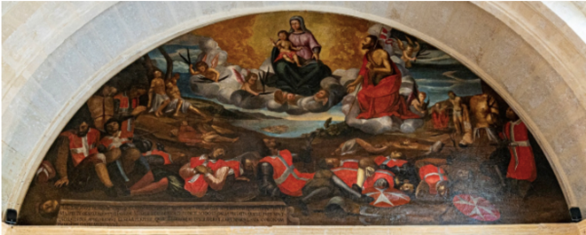
Figuur 8. Die martelaarskap van die Ridders van Malta te Fort Sint Elmo op 23 en 24 Maart 1565. Onbekende kunstenaar, 275 cm x 590 cm. Eetsaal, monnikenklooster van die Franciskaanse kloosterlinge, Rabat (Stone 1997:166)