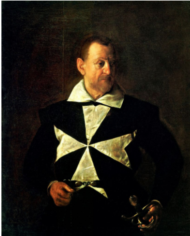
Figuur 4. Fra Antonio Martelli. Caravaggio, Pittu Paleis in Florence

In die herfs of winter van 1607 word Caravaggio gevra om 'n portret van een van die senior en mees uitnemende Ridder van Malta, Fra Antonio Martelli (Figuur 4), te skilder (372). Volgens Graham-Dixon (372) is dit een van die mees indrukwekkende portrette van die 17de eeu. Dit beeld 'n hardvotige en kragtige man uit wat in die verte staar, asof hy na binne reflekteer en sy herinneringe aan ou gevegte orden.