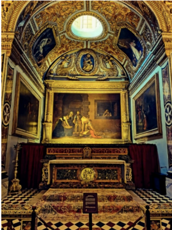
Figuur 6. Die Oratorium van S. Giovanni Decollato in die Medekatedraal van Sint Johannes, Valletta

In die eerste helfte van die 17de eeu het die Oratorium (Figuur 6) egter anders daar uitgesien as vandag (Stone 1997:161).