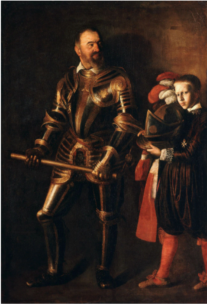
Figuur 2. Alof de Wignacourt en sy hofknaap. Caravaggio, Louvre (Wikidata, aanlyn)