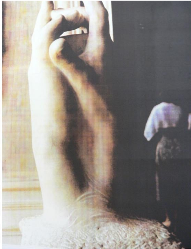
Diagram 4: Die Geheim (Rodin)

In die Rodin-museum in Parys is daar ‘n merkwaardige stukkie beeldhouwerk (genoem “Die Geheim”) wat iets belangrik sê. Kyk Diagram 4.