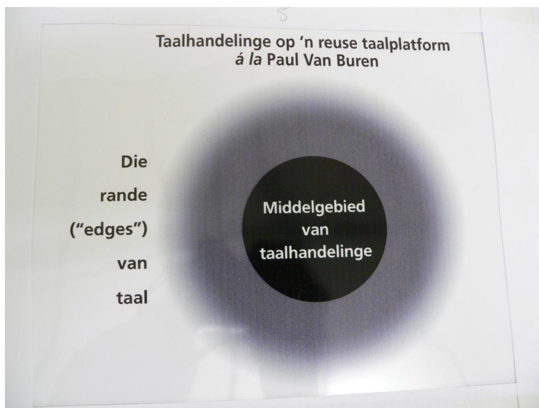
Diagram 5: Taalhandelinge op ‘n reuse-taalplatform

Om iets meer hieroor te sê, bedel ek ‘n beeld by die die filosoof Paul van Buren (Van Buren 1972) uit sy boek “The edges of language” (Sien Diagram 5).