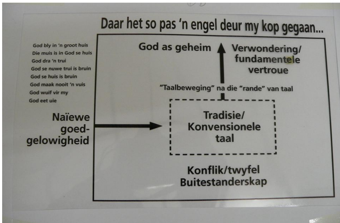
Diagram 6: Taalbewegings na die "rande van taal"

Maar ons weet ook die kind se belewenisse van en taaluitings oor God sal in die reël verander. Deur onderrig, lering en voorbeeld trek ons ons kinders algaande in in die tradisie en konvensionele gebruik van taal – ook hoe om uitdrukking aan God te gee in die amptelike kerkspraak: om die "korrekte" leerstellige dinge oor God te sê.