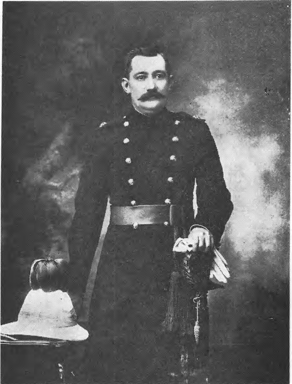
Genl. J.C.G. Kemp as stafoffisier van die Unie-Verdedigingsmag