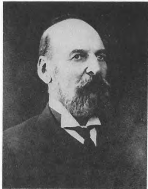
Genl. J.H. de la Rey