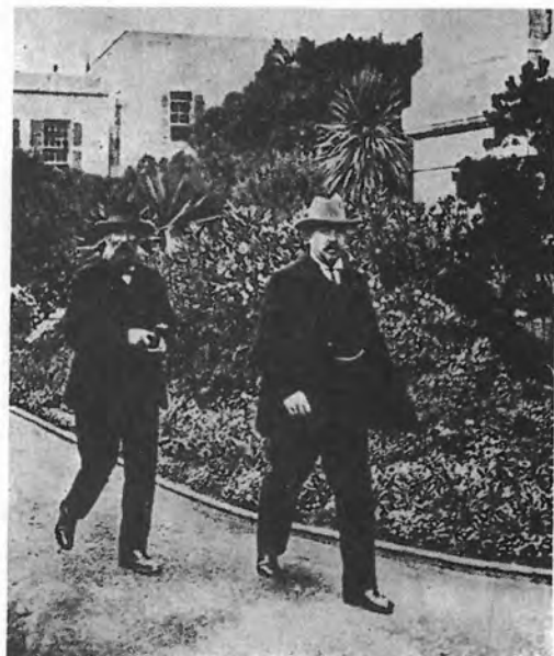
Genls. De la Rey en Botha buite die Parlement, 12.9.1914