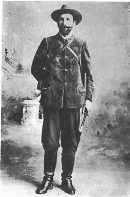
Genl. C.F. Beyers