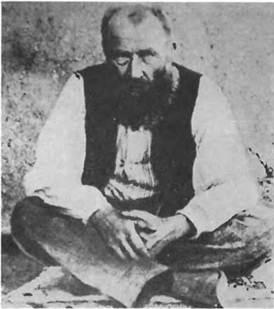
"Siener" van Rensburg