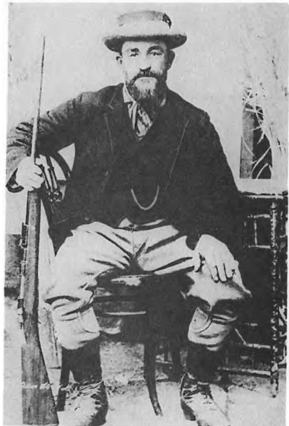
Genl. C.R. de Wet