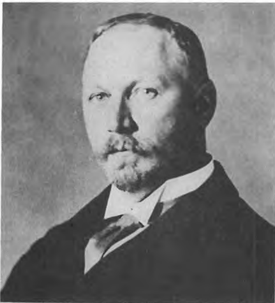
Genl. J.C. Smuts