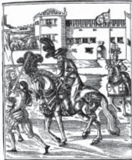
Figuur 7. Die mistiese Christenmonarg Preste João uitgebeeld op 'n perd in hierdie 15de-eeuse Portugese gravure. Let op die Portugese ridder te perd regs, met 'n vlag waarop die wapen van die Portugese koningshuis voorkom. Op die borsplaat van die perd is die kruis van die Orde van Christus duidelik sigbaar.

Sedert die einde van die 14de en die begin van die 15de eeu is die ryk van Preste João deur die Portugese gelykgestel aan dié van die heerser van Ethiopië [Fig. 7] en daarna is pogings aangewend om dáár met hom in verbinding te kom. 53