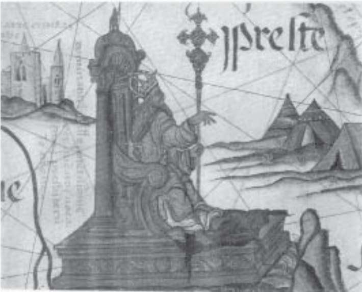
Figuur 6. Preste João op sy troon. In die agtergrond is sy luukse tente waarin hy gewoon het en waartoe min persone toegang verleen is.

Preste João en sy gevolg het in rooi en wit tente gewoon [Fig. 6] en soos nomade van plek tot plek getrek na gelang politieke en militêre omstandighede dit