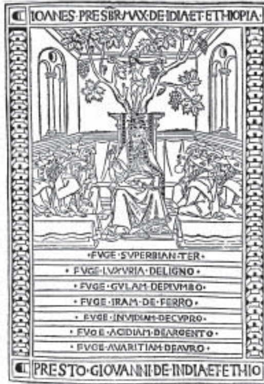
Figuur 1. Denkbeeldige Middeleeuse voorstelling van Preste João. Let op die kruisbeeld bokant sy troon en sy “pouslike” houding.

(Uit: W.J. de Kock, Portugese ontdekkers om die Kaap (A.A. Balkema, Kaapstad, 1957), p. 31)