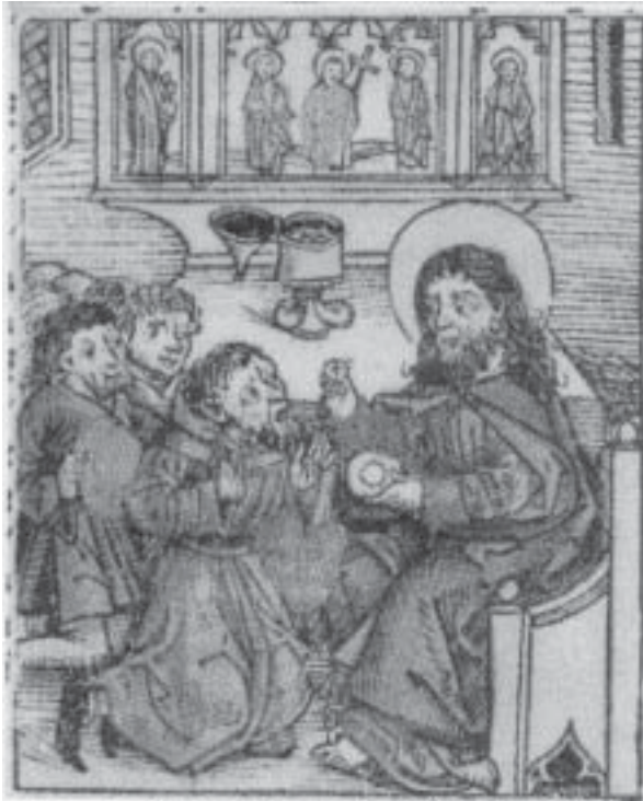
Figuur 2. Preste João, uitgebeeld as die Christenvors wat Nagmaal bedien – kompleet met ligkrans om sy hoof.

João beskryf, 13 maar toe ambassadeurs van keiser Zara Yaqob van Ethiopië in 1441 die Konsilie van Florence bygewoon het, was hulle verward om te hoor dat die prelate voortdurend na hulle heerser as Preste João verwys het. Hulle het die aanwesiges daarop gewys dat onder hulle keiser se koninklike benamings nêrens so ertitel voorkom nie. Maar die Europeërs wou Preste João in Ethiopië hê en het die heerser aldaar as sodanig betitel. 14