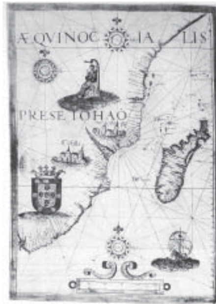
Figuur 4. 'n Voorstelling van Preste João op 'n kaart wat deur 'n anonieme kartograaf geteken en in Sebastião Lopes se atlas (ca.1565) opgeneem is.

'n Kaart uit 1447 toon torings aan die voet van die Kaukasusgebergte met die byskrif dat die torings deur Preste João gebou is om die Tartare se opmars teen hom te stuit. 26 Op 'n anonieme kaart uit 1502 wat op 'n Londense veiling deur 'n Franse geleerde, dr. E.-T. Hamy, gekoop en in 1896 deur hom gepubliseer is, verskyn besuide die 5de breedtegraad en regoor Sofala [ Zafalla op die kaart] 'n afbeelding van 'n gemyterde biskopsfiguur Prete-Iam met 'n kruisstaf [ Fig. 3 ] – duidelik 'n voorstelling van Preste João. Tot teen die middel van die 16de eeu is afbeeldings van Preste João [ Fig. 4 ], die heraldiese wapen van die koningshuis van Portugal en die windroos dikwels as versiering op kaarte van Suidelike Afrika gebruik om die gebrek aan kennis oor die binneland te verbloem. 27