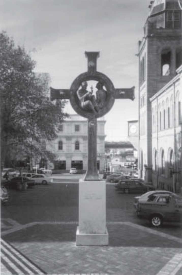
Figuur 9. Gedenkteken vir Preste João en die Portugese seevaarders wat probeer het om met hom in aanraking te kom. Dié Koptiese kruis met die beeldgroep in die sirkel, wat deur Phil Kolbe gebeeldhou is, is in 1986 in Port Elizabeth onthul.