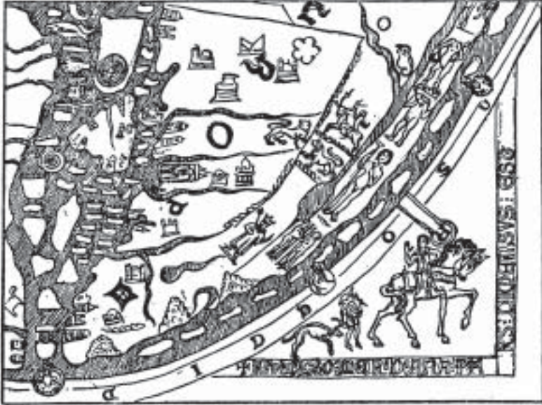
Figuur 8. Afrika volgens 'n wêreldkaart wat teen die einde van die 13de eeu geteken is. Preste João word uitgebeeld met 'n kroon op sy hoof en 'n septer in sy hand en hy is geplaas by die oorspronge van die Nyl en die riviere wat in die Atlantiese Oseaan uitmond; 'n aanduiding van waar sy ryk veronderstel was om te wees.

(Uit: G. Renault, The Caravels of Christ (George Allen & Unwin Ltd., London, 1959), p. 43)