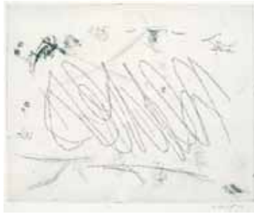
Afbeelding 4 Willem Boshoff, (2003), Neves 1 , ets. 522.5 x 63.5cm (Boshoff 2013)

se inhoud onleesbaar is vir sowel die aanskouers as Mandela, is hierdie toespraak se inhoud aan Mandela welbekend maar word die inhoud van die aanskouers weerhou.