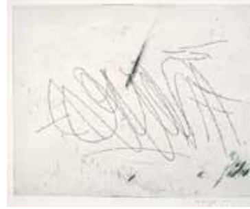
Afbeelding 5 Willem Boshoff, (2003), Neves 2 , ets. 522.5 x 63.5 cm (Boshoff 2013)

Nie net is die lettertjies mikroskopies klein nie, maar die meeste van die Letters is ook verkeerd om geplaas sodat dit slegs deur die refleksie in 'n spieël gelees kan word. Boshoff verduidelik sy werkwysse soos volg: