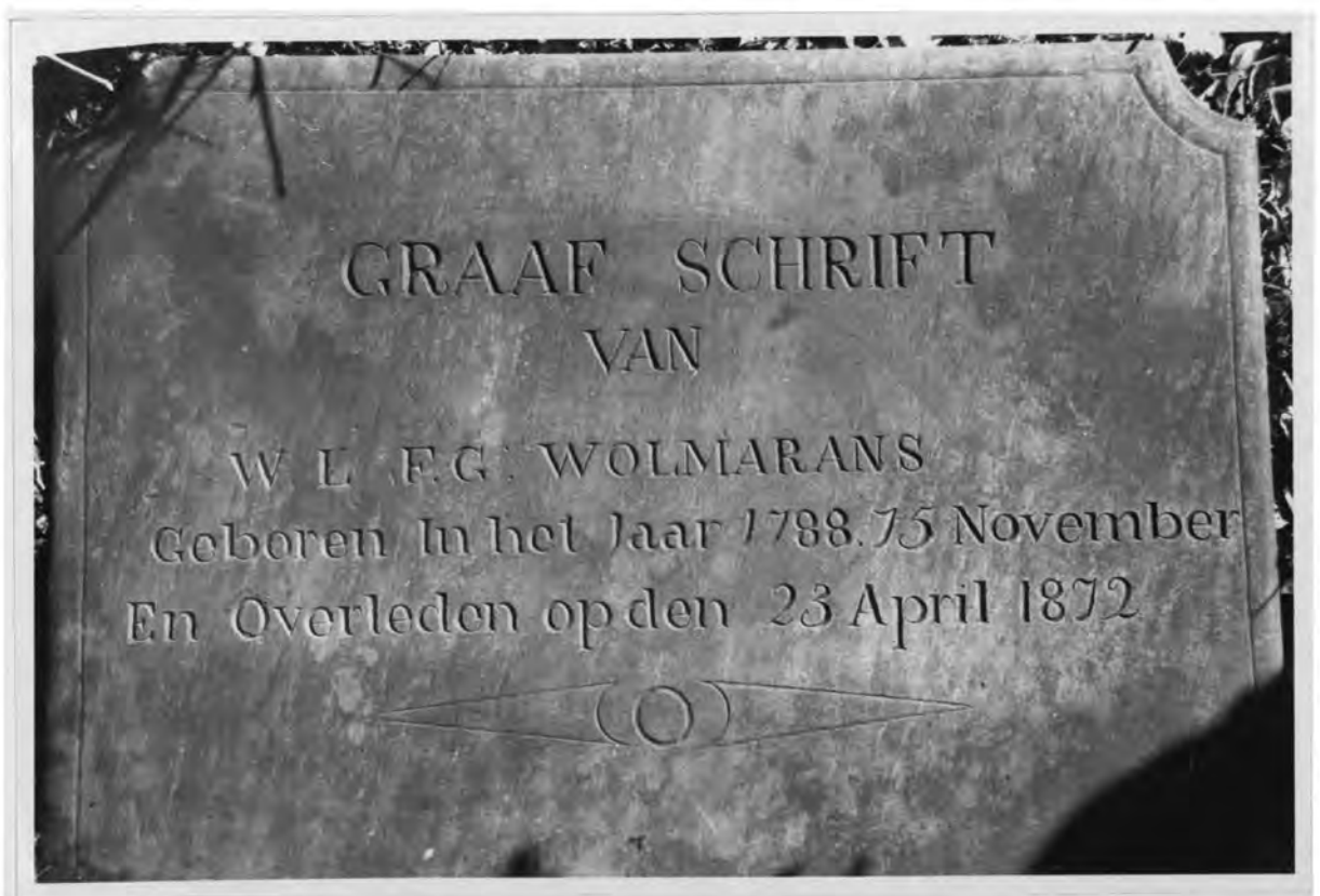
Die grafskrif van F.G. Wolmarans, wat plat op die graf aangebring is, is ontbloot nadat bosse, blare en mos verwyder is.