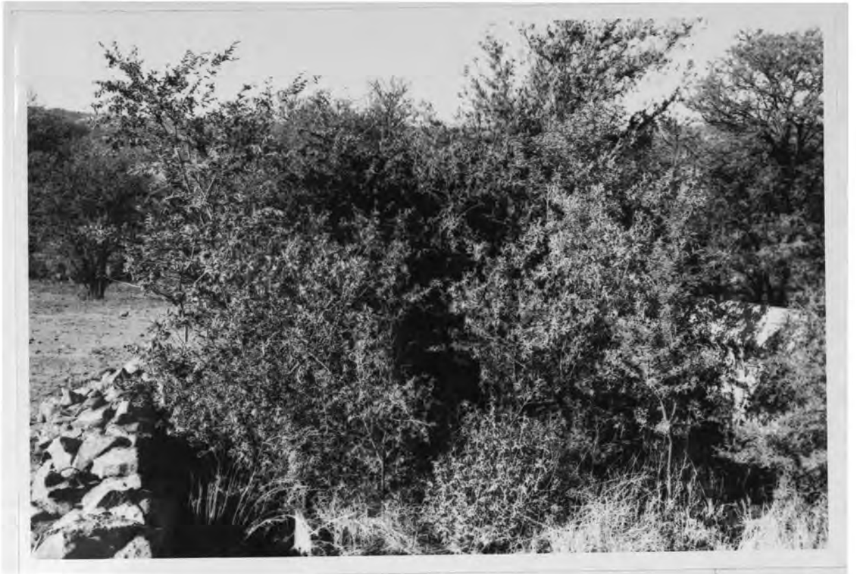
Die graf van F.G. Wolmarans, struik- en bosbe- groeid na 94 jaar.