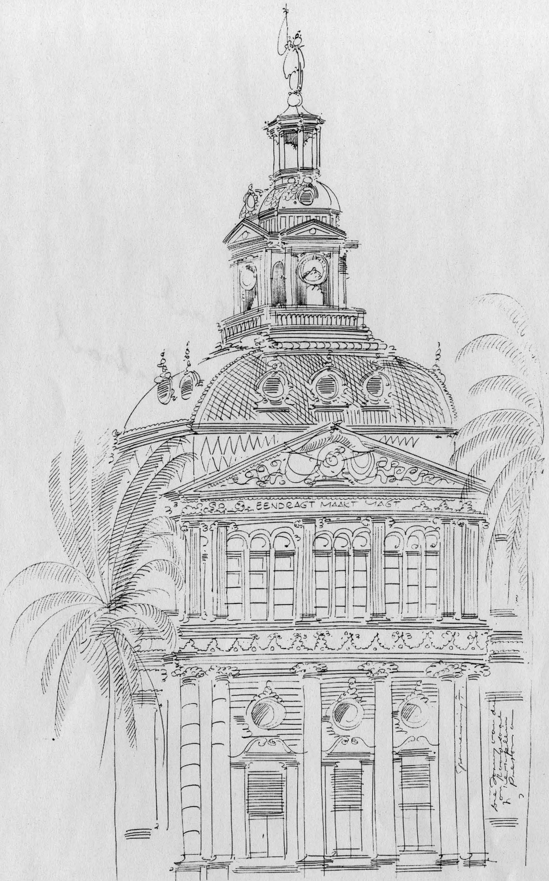
Tower of the Old Raadsaal