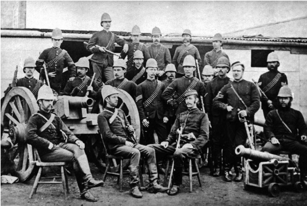
Twee verouderde kanonne in die Britse Kamp tydens die beleg van Pretoria.

Ek was nog nooit seker watter van die talle ou Transvaalse kanonne Lys se kanon was nie. Ek vermoed dit was die kanonnetjie regs op die aangehegte foto. Hierdie 2-ponder yster kanonnetjie, gemonteer op 'n gietyster onderstel met 'n Union Jack motief, is afgeneem in die kamp tydens die beleg. Na Majuba is dit aan die Boere oorhandig en volgens Majoor Lood Pretorius is dit daarna gebruik om die middaguur skoot in Pretoria te vuur. Dieselfde ou kanonnetjie was nog by die Boomstraat Museum te sien voordat dit gesluit is, en is vandag in die store van die Kultuur-Historiese Museum.