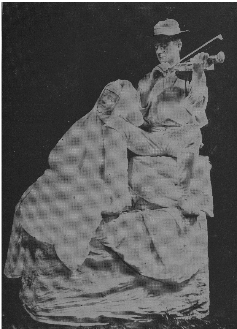
Tablo waarin „Dood” voorgestel word. Opgevoer te Deadwood, St. Helena.