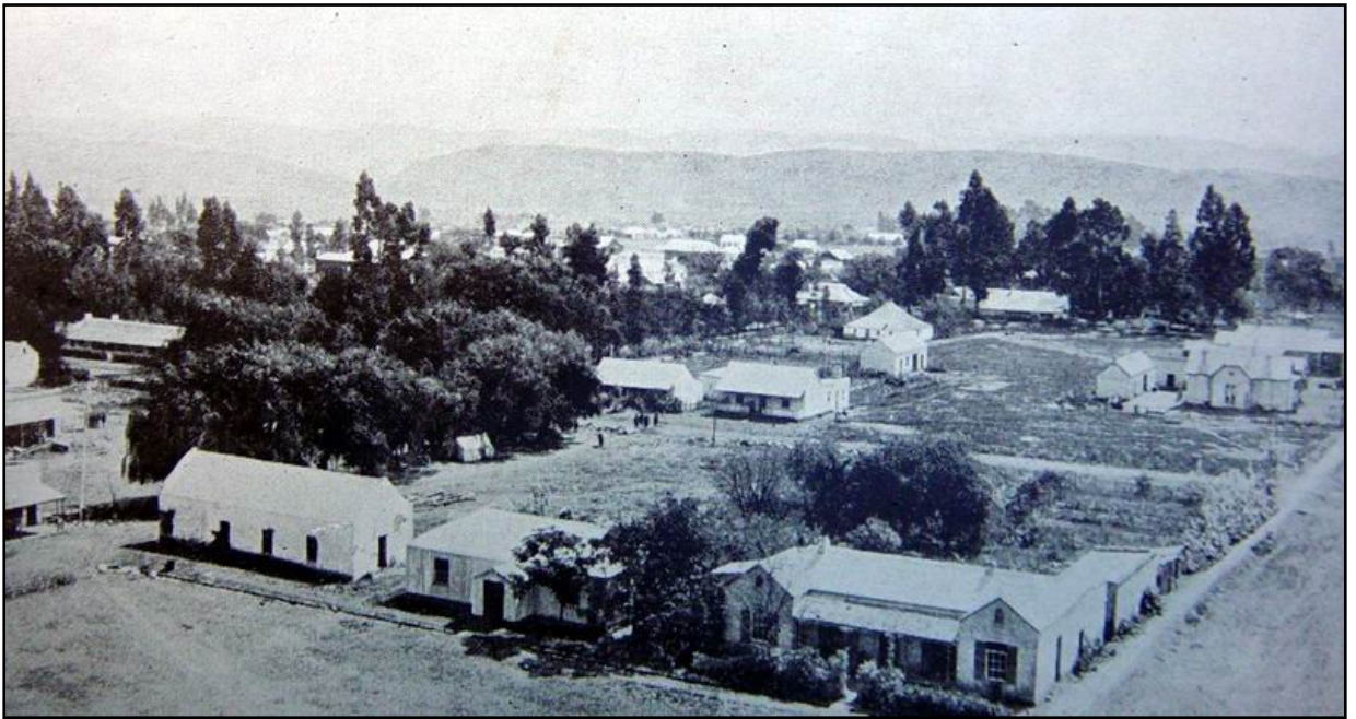
Skoolgebou, kantoor van Mynkommisaris en die ou Pastorie