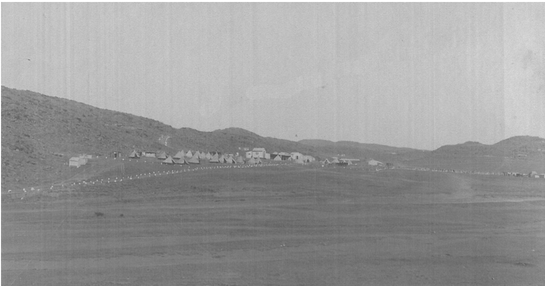
Heidelberg konsentrasiekamp, 1901