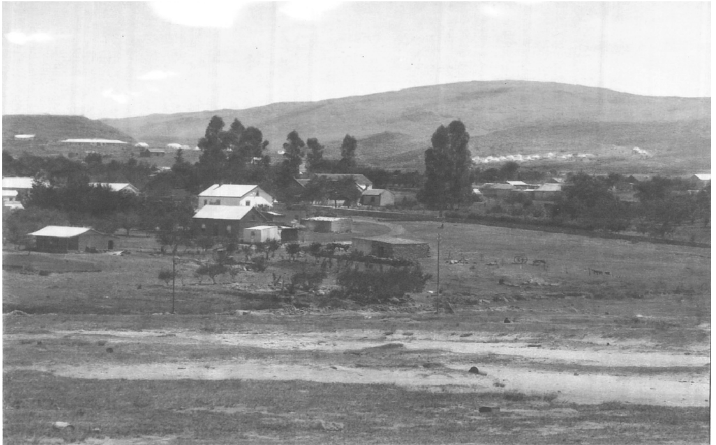
Heidelberg en die konsentrasiekamp op die agtergrond