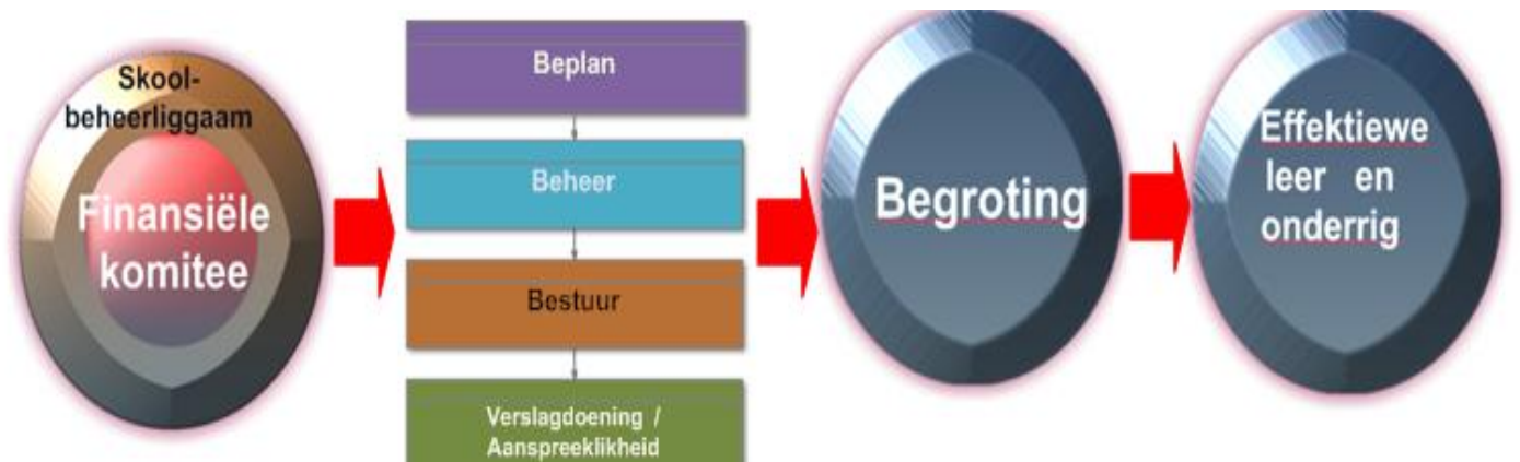
Figuur 2.1: Konseptuele raamwerk van toepassing op hierdie studie (Eie raamwerk)

Soos in figuur 2.1 aangedui, bring die raamwerk verskillende strukture en konsepte in perspektief. Die komponente van die model word vervolgens bespreek.