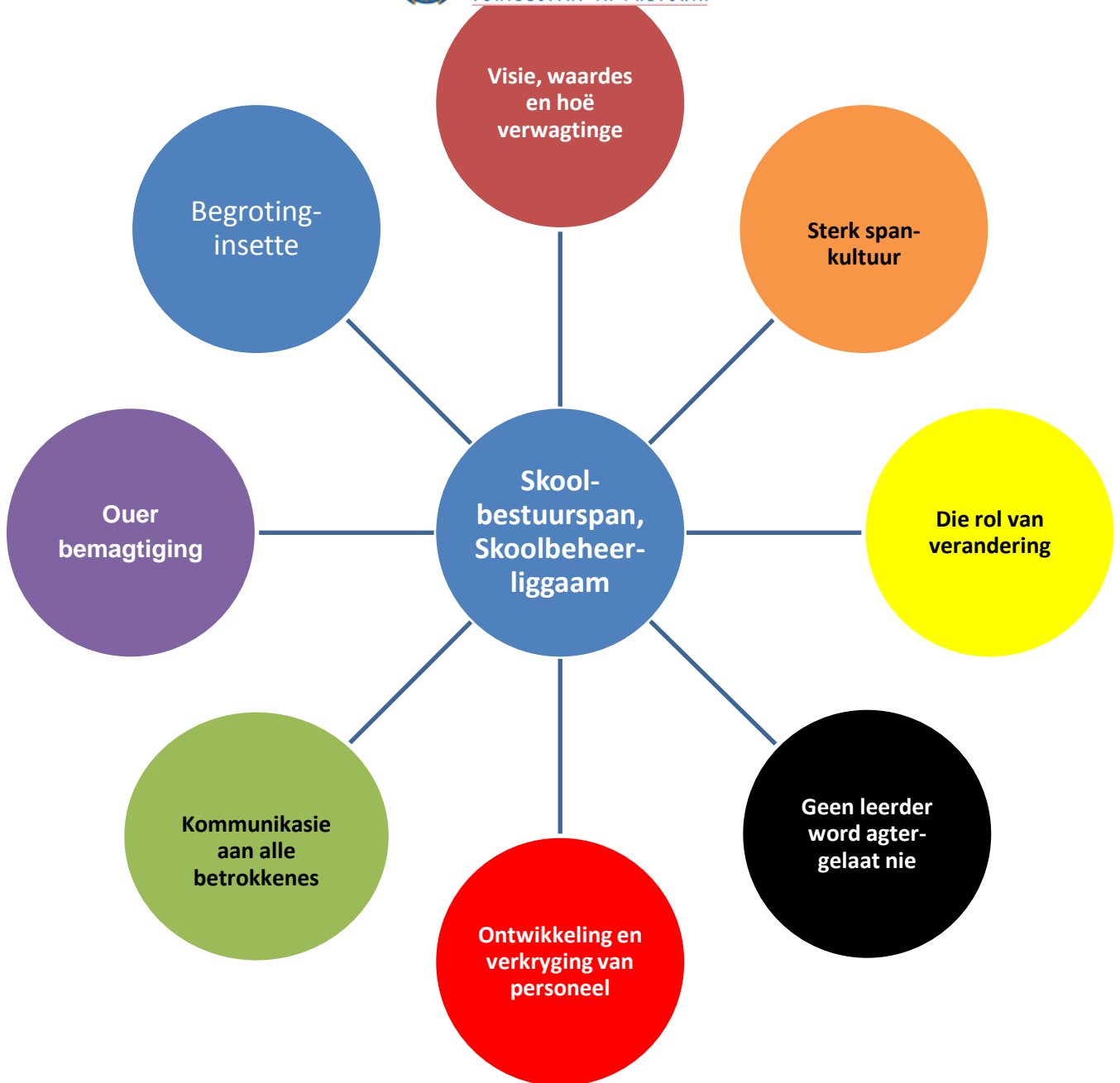
Figuur 2.4 Faktore wat effektiewe onderrig en leer bepaal

Vervolgens word die navorsingproses in detail bespreek, spesifiek met betrekking tot waar en wanneer die navorsing plaasgevind het, hoe dit plaasgevind het en aan wie en waarom daar vraelyste aan spesifieke respondente gestuur is. Die proses waarvolgens die analise van die data plaasgevind het en die beperkinge van toepassing op hierdie navorsing word volledig bespreek